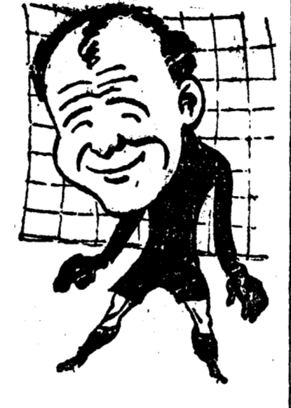
FOOTBALL.—ALEXANDER MUTCH Guardameta del Huddersfield Town, equipo de la primera división inglesa, ganador de la célebre Copa de Inglaterra.

más y el que menos sabe perfectamente el valor de muchos jugadores españoles seleccionables o indiscutibles. Hoy por hoy, el football español está muchísimo por encima del francés. España sobre todos Tal vez pasa desapercibidamente pero es lo cierto que en lo que se relaciona con los partidos internacionales España ocupa el puesto de honor. Los ingleses fueron vencidos por los