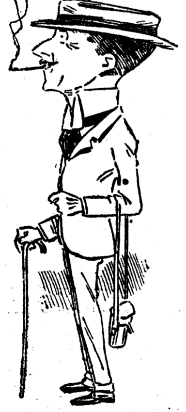
LORD CARNARVON Celebrado propietario inglés, que ha ratificado el 1.º de mayo la inscripción de su caballo «Franklin» en el premio del «medic millón», la gran prueba española que se celebrará el 10 de septiembre próximo.

Lea usted dentro de esta semana las impresiones acerca del partido final del campeonato de España, con el plano del campo. ¿Es usted «barcelonista»? ¡Píñese usted el triunfo de los «franceses»! Recorte usted su escudo favorito, que publicará EL DEBATE; préndalo con un alfiler, y allá en el campo de Caya, de Vigo, refínese con «su gente» para animar al conec preferido.