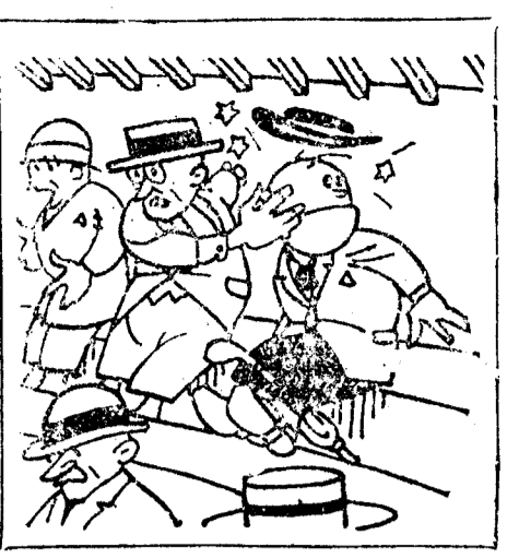
—¡Ole tu madre! ¡Ole tu garbón! ¡Faff! Usted perdona, don Paco, que le dé una bofetada; es para aplaudir al Alcañal.