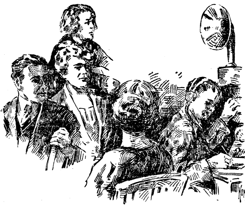
La radiotelefonía permite escuchar un concierto dado a 800 millas de distancia (Del «Literary Digest», de Nueva York)

Instalaciones en trenes y barcos. Aparatos de bolsillo