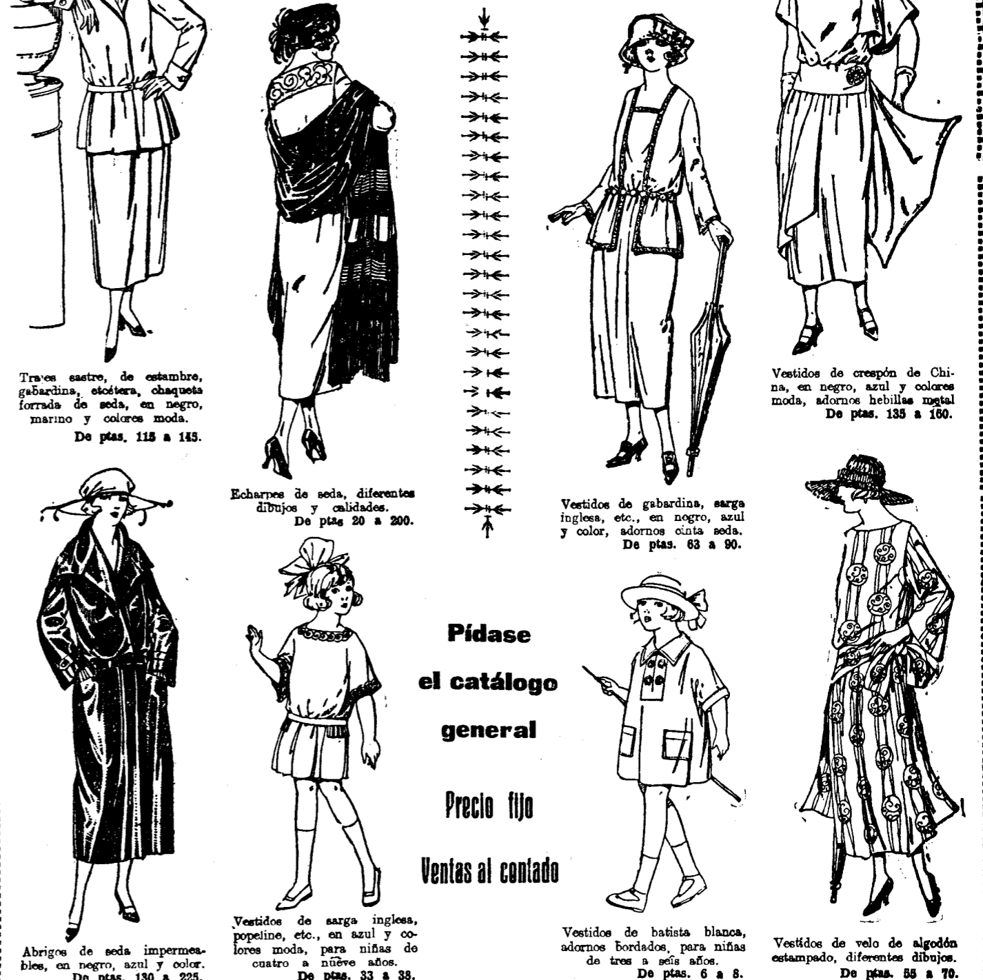
Traje de cuero, de estambre, gabardina, etcétera...