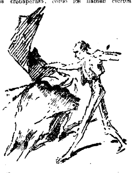
Un pase de pecho de Nacional II