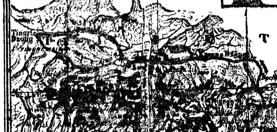
La línea negra del gráfico señala la marcha de la expedición Howard Bury hasta la vertiente Norte del Everest...