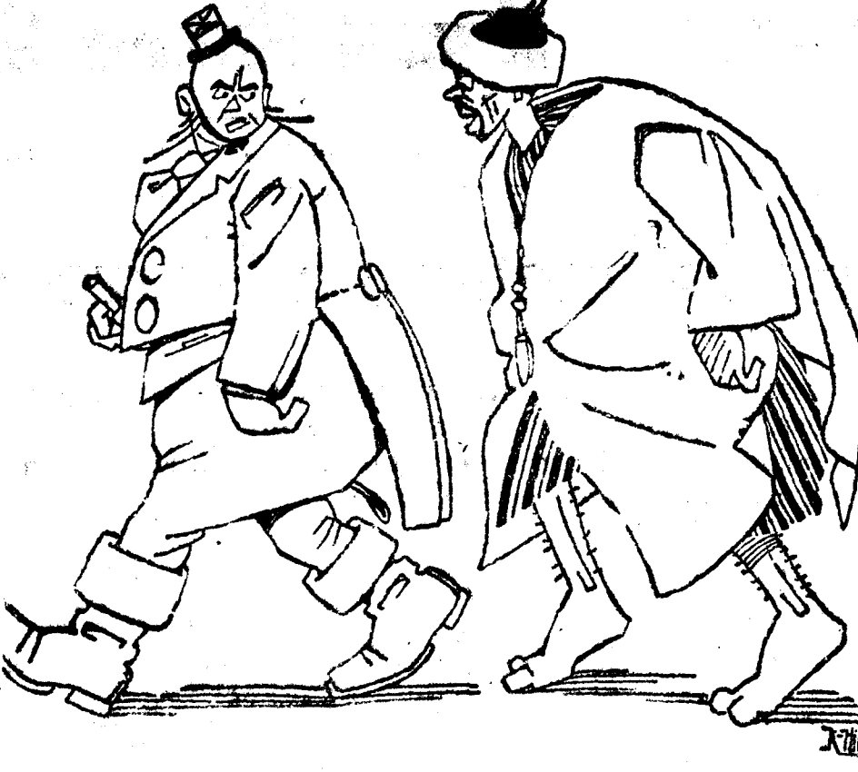
—¿Me reconoces? ¿Me reconoces?