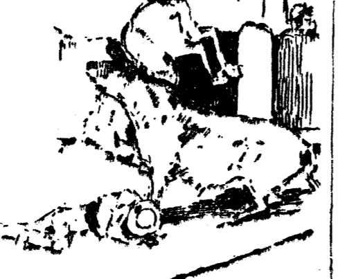
Una caída al desahucio en el segundo toro

Entró dos veces a cada uno de sus enemigos y tuvo a su cargo la correspondiente