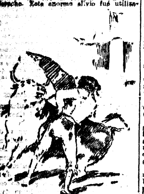
Morenito de Zaragoza en su primer toro.

Tuiste el domingo el lote ideal. Su primer novillo fué un japonero mogón del bicho. Esta enorme alivio fué utilizado