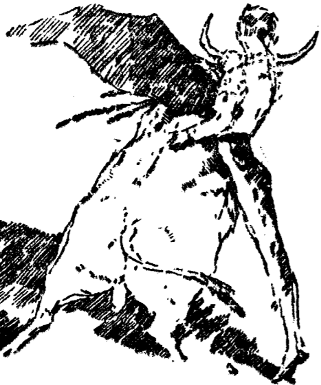
Carrañafuente en su gran paso al segundo toro

Todo lo hizo en su primera res, sin dejarlo para luego. Torero de capa con oída