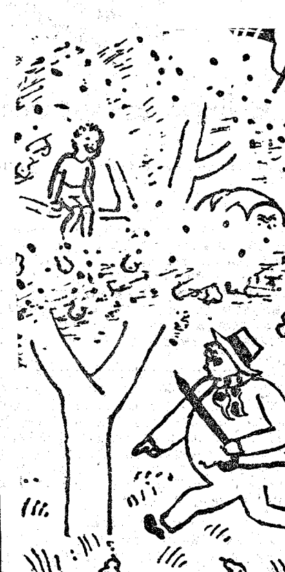
—¡Si no bajas ahora mismo de ahí, llamo a tu padre! —¡Pues está aquí arriba también!