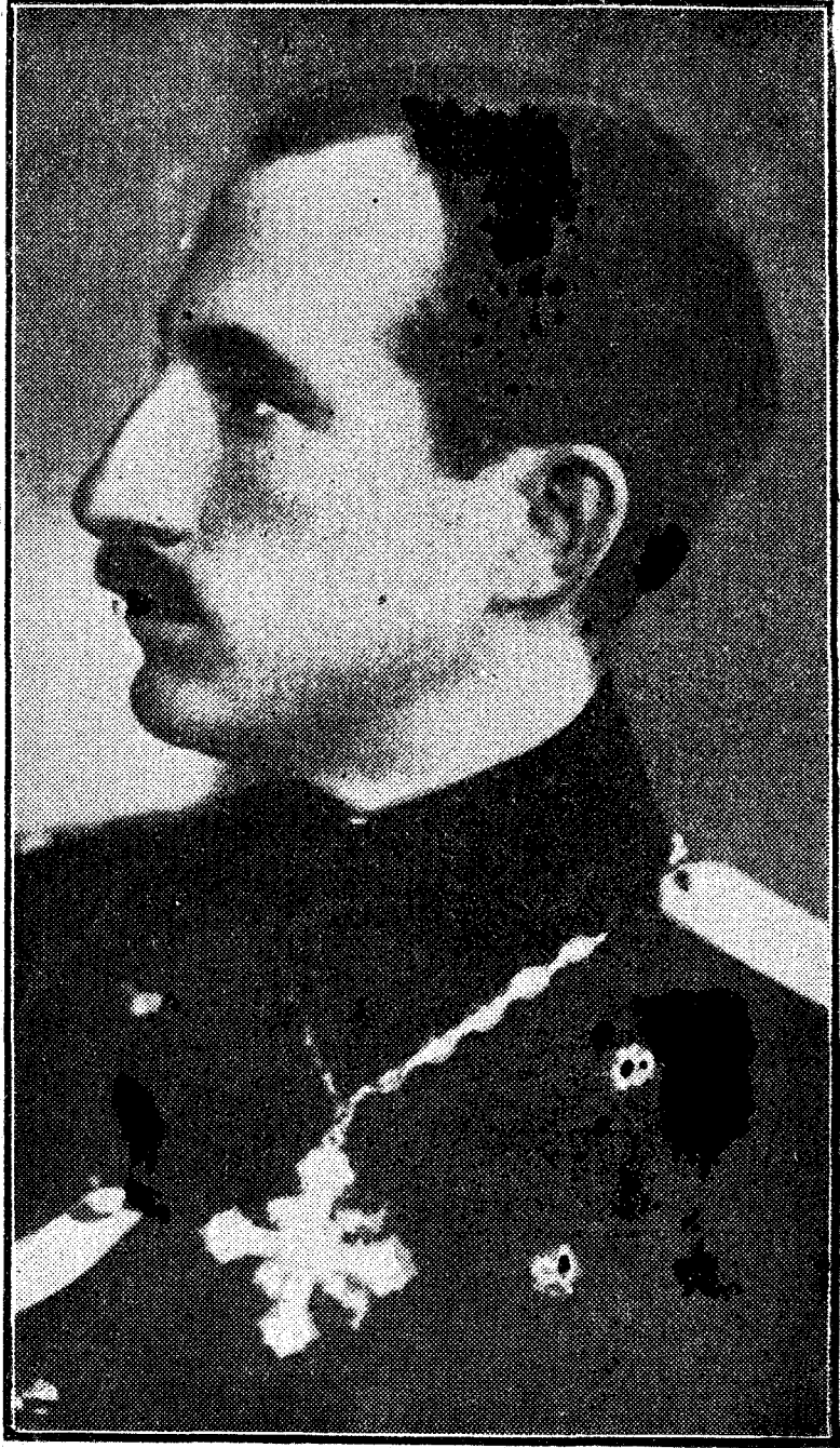
El Rey Boris de Bulgaria, que acaba de realizar un viaje por Europa, según parece, para buscar esposa

Ninguna Monarquía de las que han sobrevivido a la guerra ha pasado momentos más críticos que la Monarquía búlgara. Sin embargo, es la única que ha logrado mantenerse en los países vencidos, y esto dice no poco en favor del tacto y de la inteligencia del Rey Boris. Heredó el Trono de su padre, expulsado por una revolución al terminar la guerra, cuando tenía veinticuatro años. Después ha tenido que hacer frente a graves dificultades, que culminaron con el terrorismo comunista de hace dos años. En aquella ocasión dió el monarca una prueba de su valor y de su serenidad ante el peligro. Regresaba a Sofía cuando unos comunistas dispararon sobre su coche, matando al chófer y a uno de los ayudantes del Rey. Este, después de dejar a los heridos en una villa cercana, salió a caballo con su escolta en persecución de los asesinos.