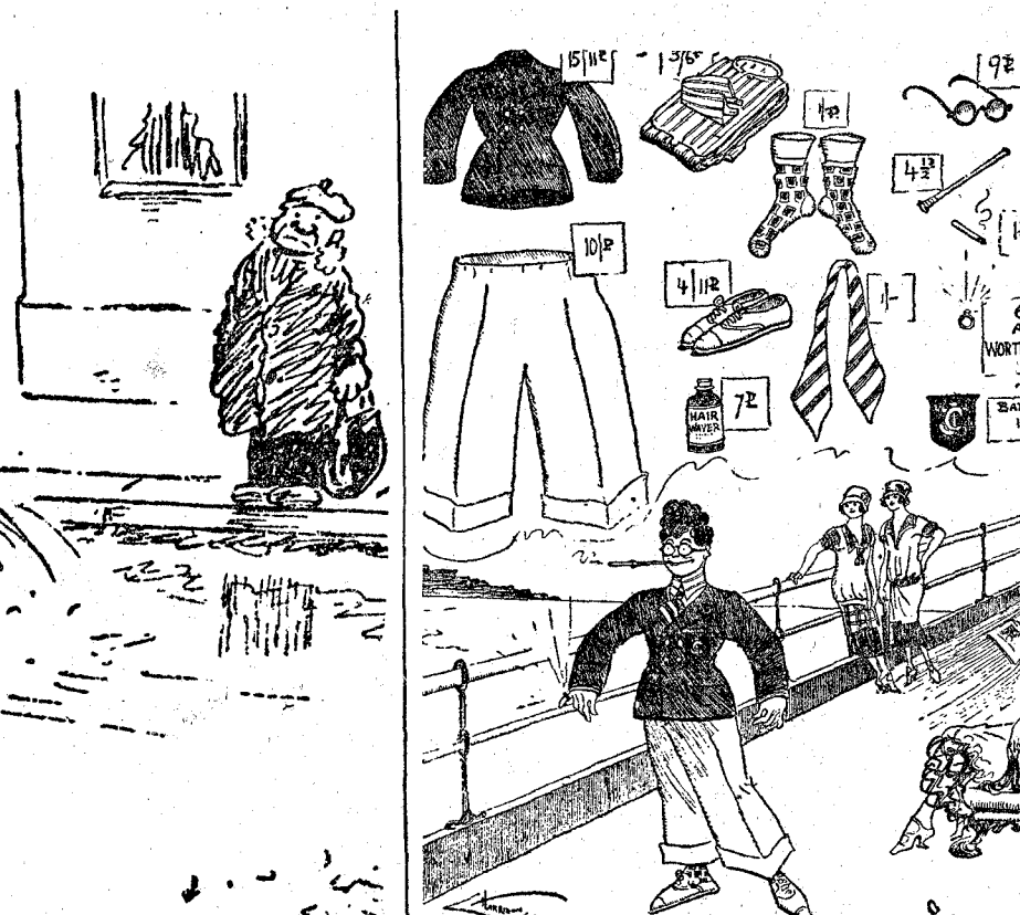
Viendo lo barato que cuesta a un hombre hacer un gran papel en la playa.