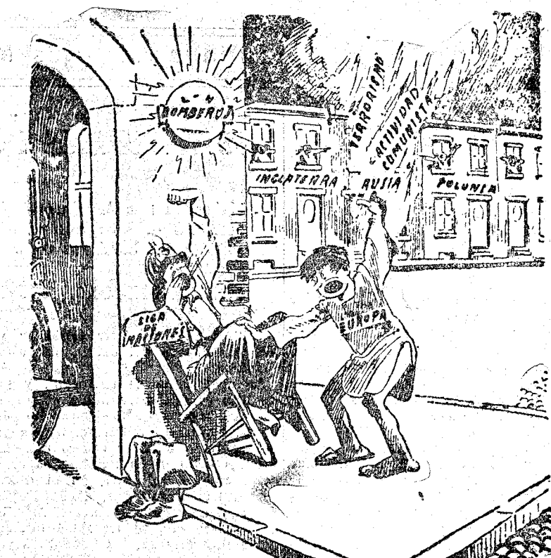
«BAH! NO CORRE TANTA PRISA!» (Filadelfia Record.)