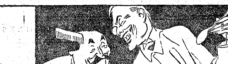
CHAMBERLAIN.—Enjábónele usted bien, querido colega. Así me será más fácil darle un buen afeitado.

El personaje que está sentado es Stresemann. Briand, persuasivo orador, es el encargado de convencerle para que se deje arrancar las concesiones necesarias.