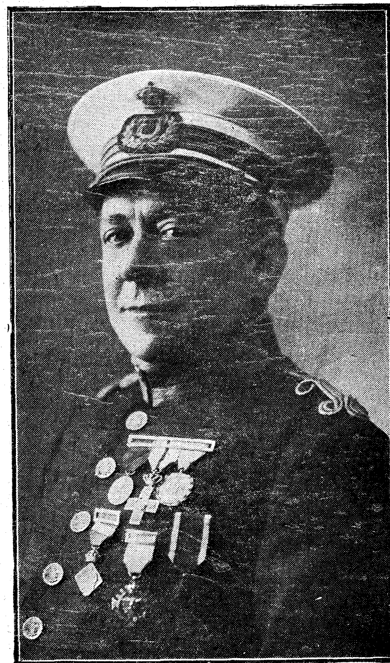
El director de la Banda Municipal de Madrid, que ha obtenido un triunfo en Lisboa