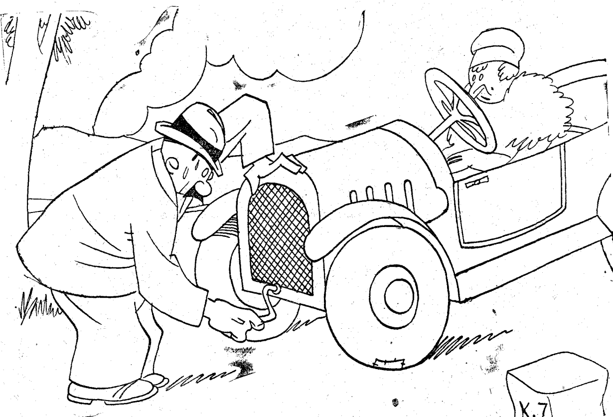
LA SEÑORA (al marido, que lleva media hora tratando de poner el coche en marcha).—¿Ves tú? Ya te dije que trajésemos al hermano de la criada. —¿Qué sabe él de automóviles? —No importa; pero es organillero.