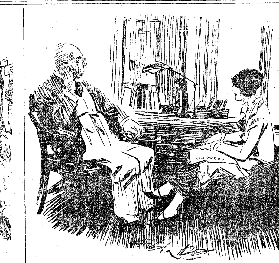
DOCTOR.—Va a ser muy difícil de evitar eso de que su marido hable alto por las noches.

EL CAMPESINO.—Pues, para decirselo con exactitud, entre diez y doce.