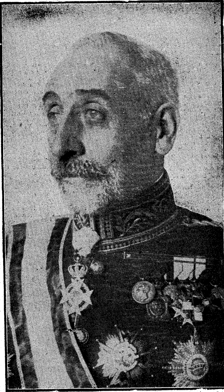
El duque de Vistahermosa, que ha sido nombrado primer introductor de embajadores

Hombre caballeroso, de profundas convicciones católicas y de siempre probada lealtad al Trono, llega a su nuevo cargo con méritos indiscutibles y después de una brillantísima carrera.