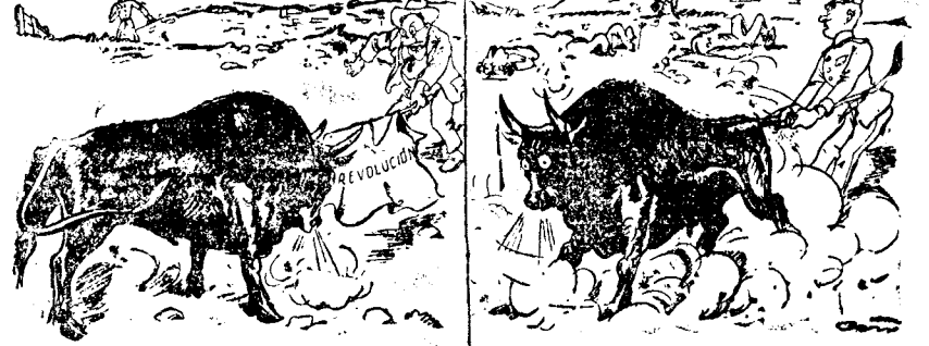
EL SOCIALISTA.—¡Eh, toro!

Es la historia de Viena... y de todas partes. El socialismo predica el odio de clases, excita al pueblo, y cuando la catástrofe se produce, «no sabe nada». La culpa es de los comunistas o de la Policía.