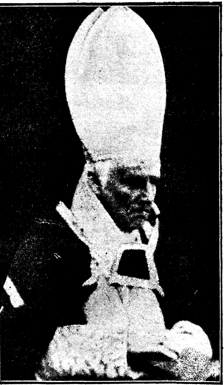
El Cardenal O'Donnell, a quien se propone para presidir en Irlanda una Conferencia de la paz

No sería la primera vez que monseñor O'Donnell interviniera en las cuestiones políticas de Irlanda. En realidad, el ilustre purpurado ha vivido desde el año 1891 en contacto con las necesidades políticas y económicas del país.