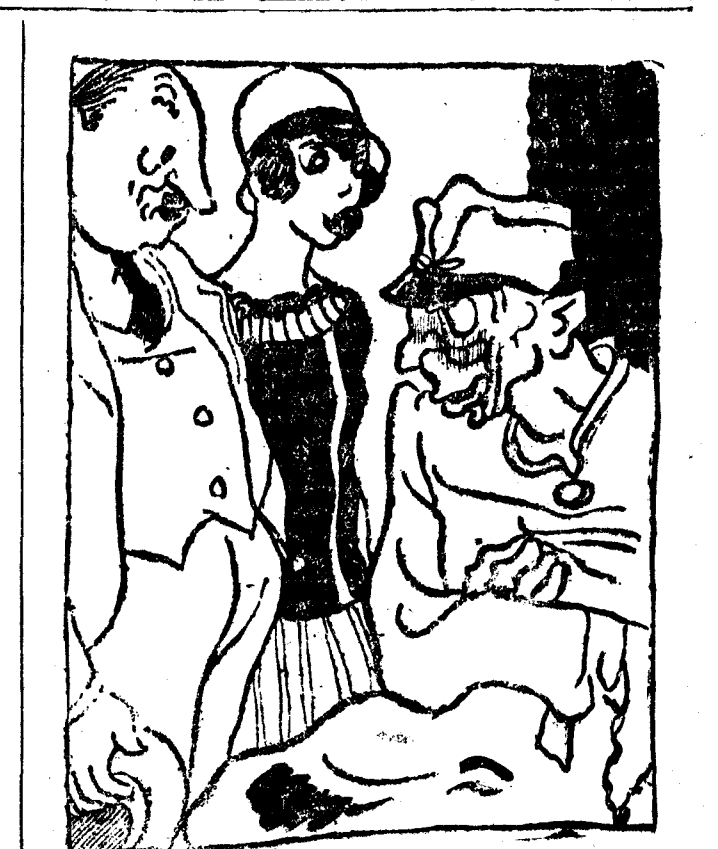
EL FENOMENO DEL PUEBLO —¿Cómo? ¿Nunca ha visto usted un avión? ¿Ni un ferrocarril? —¡Jamás! Así he vivido noventa años. (Dimanche Illustré, Paris.)