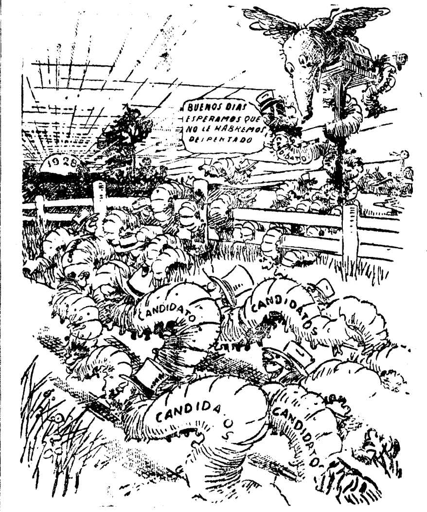
ESTE AÑO HAY MUCHOS GUSANOS (Herald Tribune, Nueva York.) El elefante simboliza al partido republicano, y los gusanos—los candidatos—, que avanzan silenciosamente, tratan de sorprenderle.