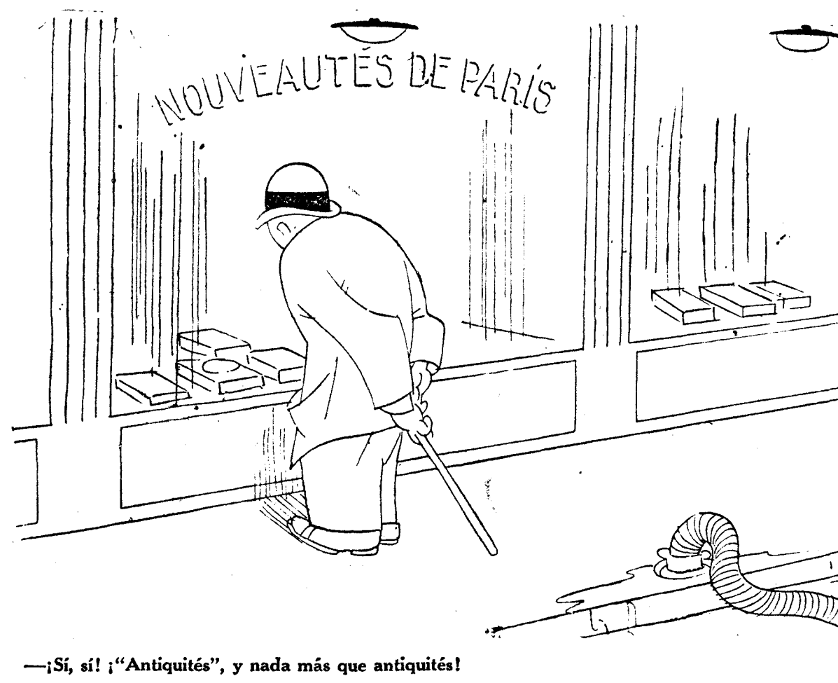
¡Sí, sí! "Antiquités", y nada más que antiquités!