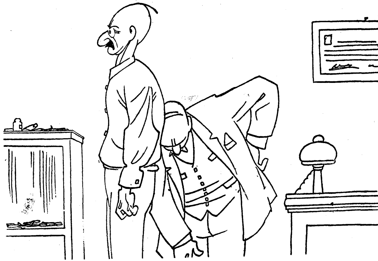
—Tiene usted una piedra en el riñón. —Bueno; pues vamos a hacer una cosa: la entregaré para el monumento a Cervantes, en vez del real.