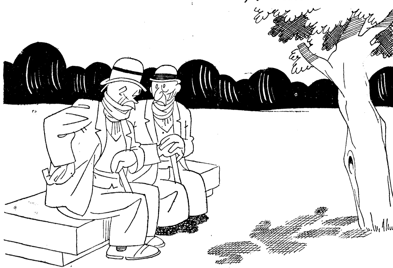
—¿Sabe usted? Se van a hacer en Madrid excavaciones arqueológicas. —¡Hombre! A ver si se encuentran aquellas casas de huéspedes de diez reales, con principio y vino.