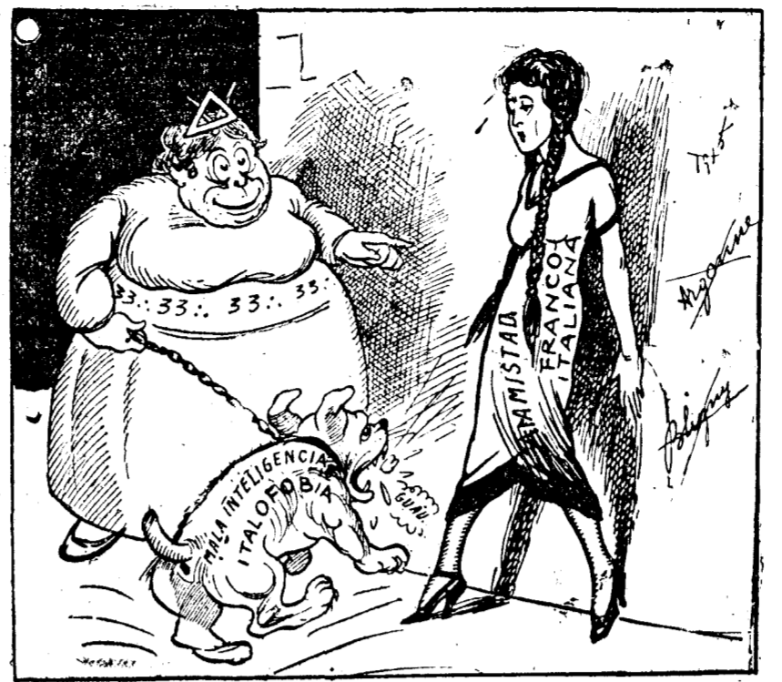
No hay modo de que la amistad francoitaliana dé un nuevo paso si no se mata antes a esa fiera. (De 420, Florencia.)