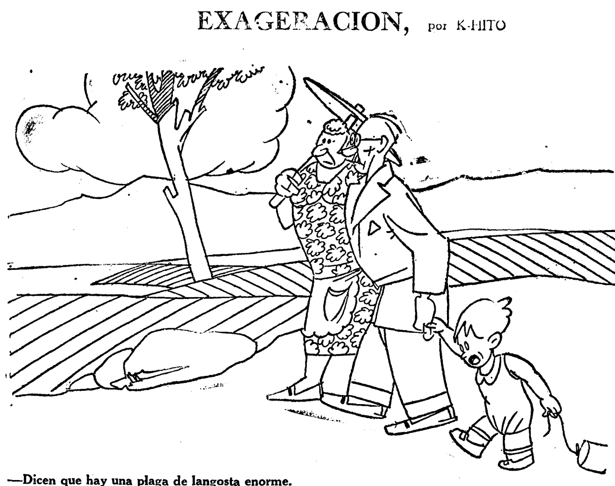
—Dicen que hay una plaga de langosta enorme. —No creas ni la mitad de lo que te digan en este pueblo; ya verás cómo son gambas simplemente.

rable a los que tan poderosamente conadyuvaron con los catalanes al primer ensayo de restauración literaria. Triste sino el de la cultura de un pueblo, marcada con el signo fatal de la decadencia! Las fuerzas disolventes y disgregadoras se apoderaron de ella y el peso de todos los factores que contribuían a formar la conciencia de su unidad, ceden de pronto al influjo corrosivo de todas las diferencias manifestadas o latentes entre sus diversos miembros.