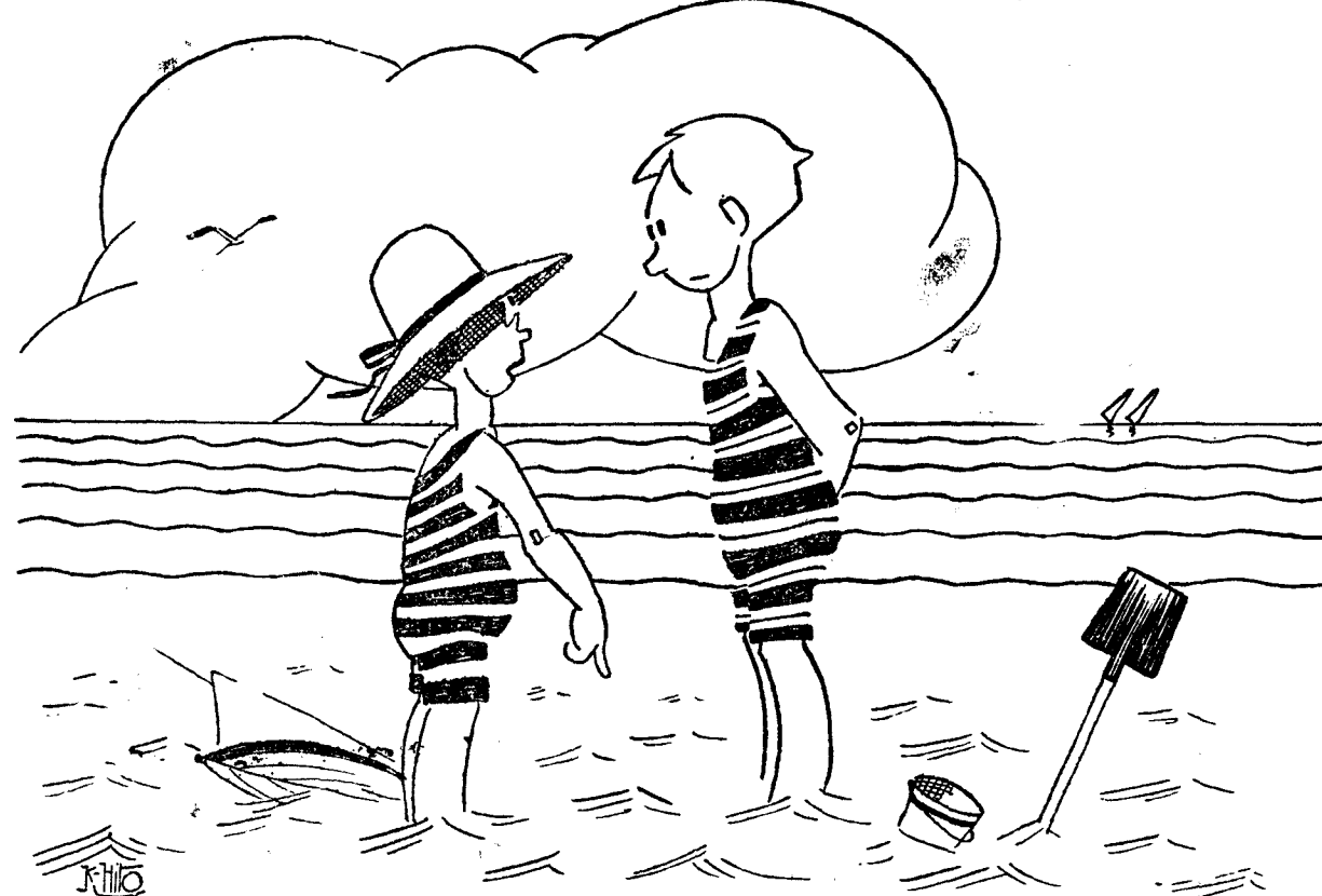
—En este mismo sitio se me perdió ayer mi reloj. —Pues vamos a buscarlo. —No te molestes; era un reloj de arena.

LONDRES, 3.—El mayor Harvey, miembro del Parlamento británico salvó con exposición de su vida a dos niñas, que estaban a punto de ahogarse en el mar del Norte.