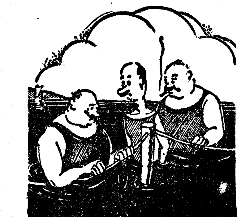
—¡Y pensar que hay gentes tan sucias que se bañan en el Mar Negro!

Los dos premios han correspondido a una misma persona; un labrador humilde, que jamás tuvo ayuda de nadie para cultivar su jardín y su huerto. Lo más de notar en este caso, y el detalle que lo hace verdaderamente excepcional y hondamente simpático, es que el labrador premiado es ciego.