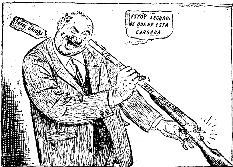
Es muy peligroso comprobar de esa manera si están cargadas las armas de fuego.