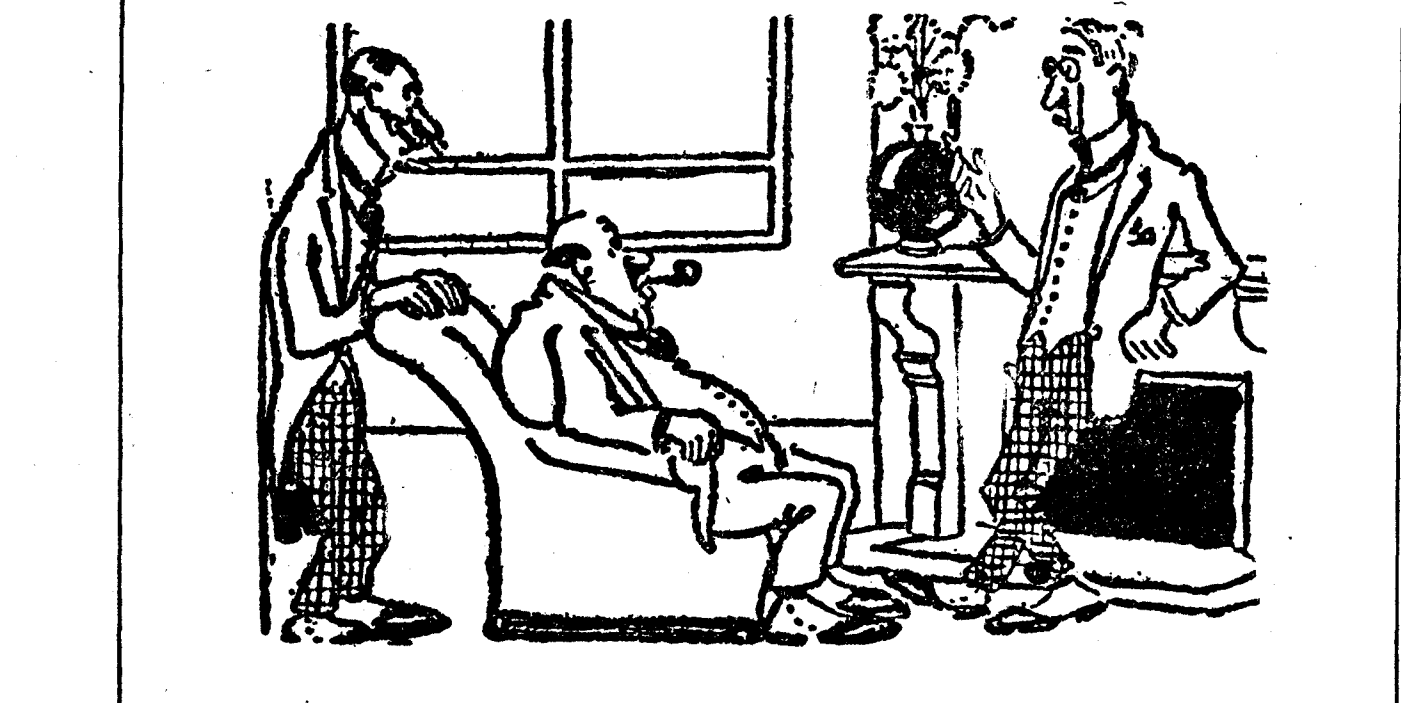
SOLUCION —Si se obligara a todos los hombres a ganarse el pan con el sudor de su frente, ¿qué haría usted, señor negociante? —Les vendería pañuelos.