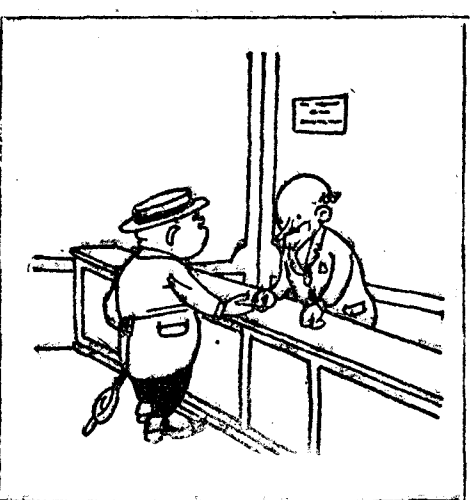
—¿Me hace usted tal feo? ¿Qué me ha grado usted la vista y no sé lo que me necesito.