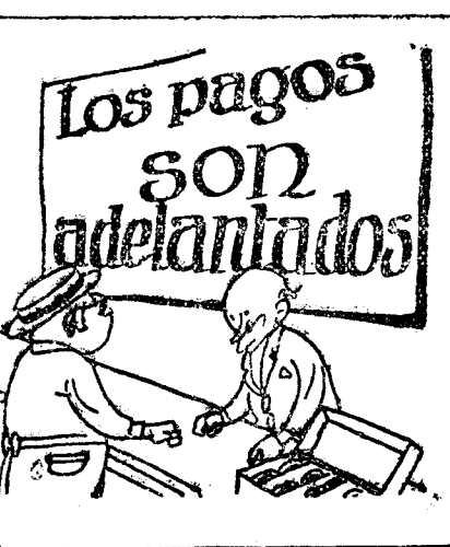
—¿Y con estas gafas?