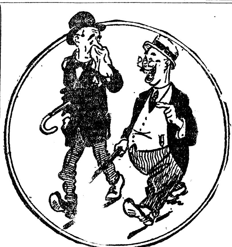
—¿Qué significa ese nudo que llevas en la corbata? —Me lo ha hecho mi mujer para que no se me olvidara echar una carta. —¿Y la has echado? —No; se le olvidó dármele. (Kasper, Estocolmo.)