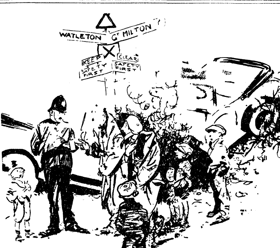
DESPUES DEL ACCIDENTE EL GUARDIA.—¿Quién ha sido el culpable del choque? UNA DE LAS VICTIMAS.—Realmente, ninguno; porque los dos veníamos leyendo las indicaciones para la circulación.