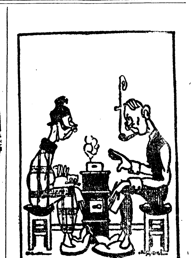
—¿Cómo termina esa novela? ¿Bien? —¡Vaya usted a saber! Termina en boda. (Le Rite, París.)