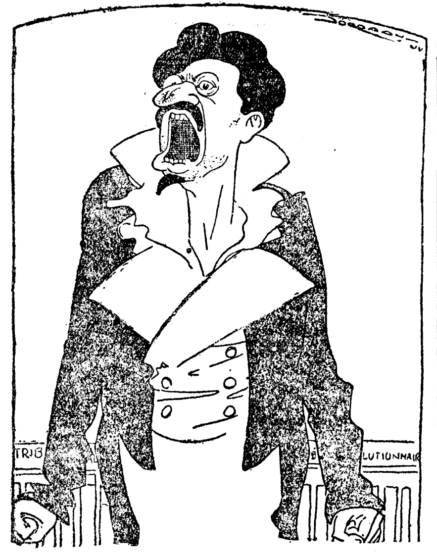
No es un éxito. Todo es pequeño en él, excepto la boca (De Groene Amsterdammer.)