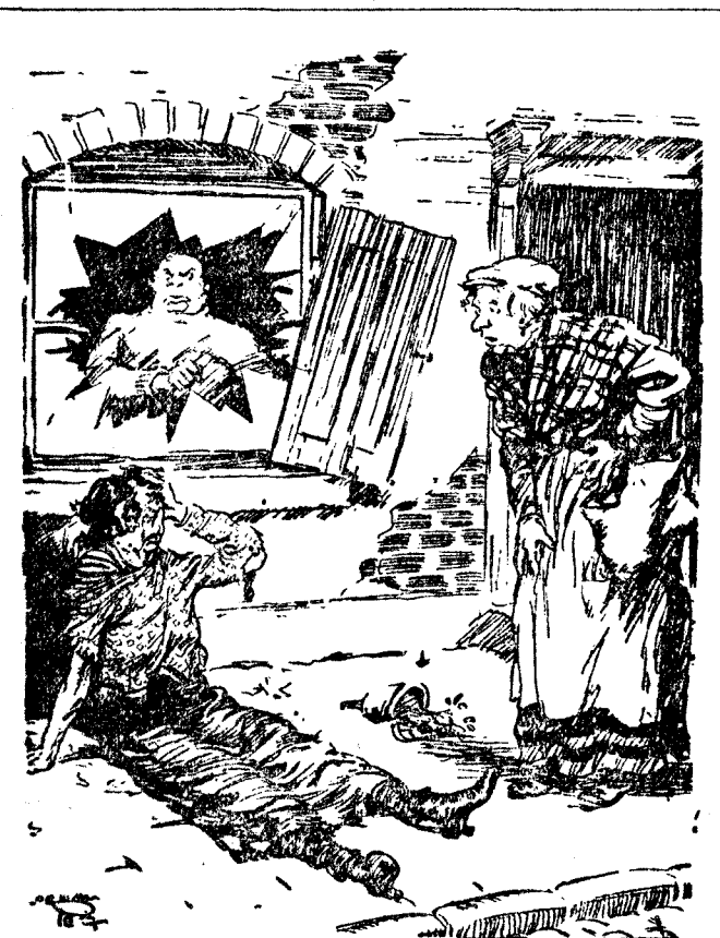
LA CASADA EN SEGUNDAS NUPIAS —¿Mi pobre Horacio era de otro modo! Siempre abría la ventana antes de tirarme. (Passing Show, Londres.)