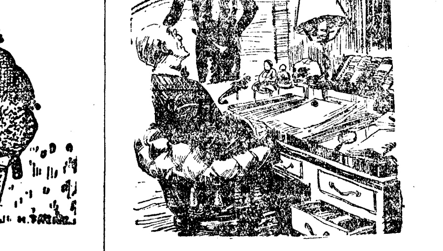
EL PROFESOR (a su novia). —Mira, querida, voy a dar la noticia de nuestro matrimonio en el próximo número de «Descubrimientos de Antigüedades». (Passing Show, Londres.)