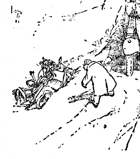
EGOISMO —Salga de ahí y venga a ver cómo me na puesto un guardabarros!