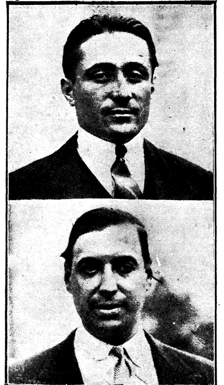
Los aviadores franceses Costes y Le Brix, que llegaron ayer a Buenos Aires en su vuelo desde París