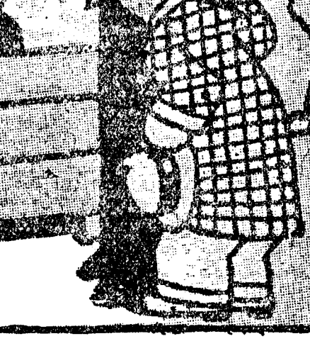
PSICOLOGIA EXPERIMENTAL LA NIÑA DE LA CIUDAD.—No; yo no quiero leche de vaca. A mi que me da la den de tarro, como todos los días. (Dorfbarber, Berlín.)