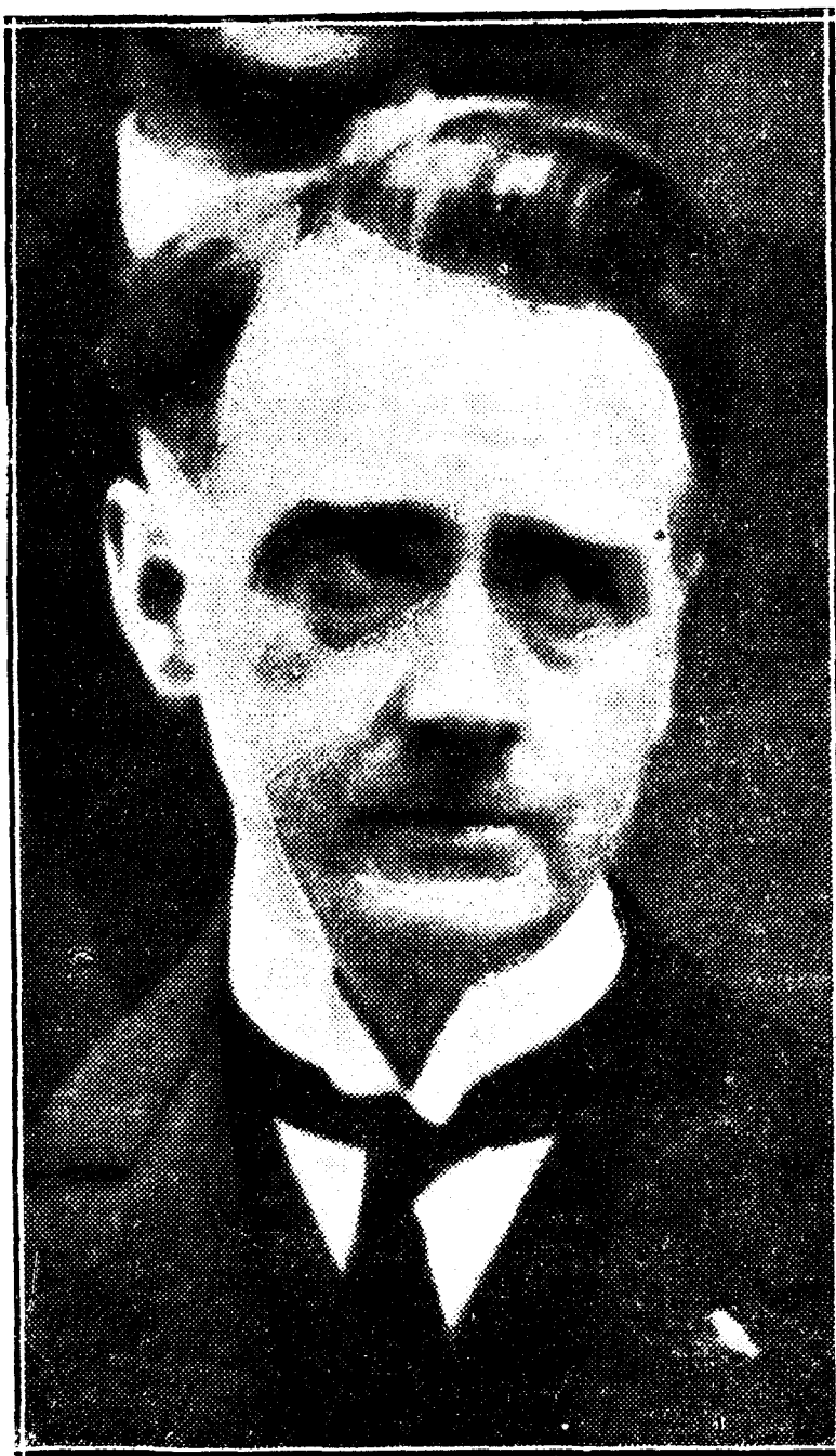
El presidente Cosgrave, elegido jefe del Gobierno de Irlanda

Las elecciones recientemente celebradas mejoraron algo la posición del Gobierno irlandés, pero al mismo tiempo reforzaron a los de los partidarios de De Valera. Alguien propuso al presidente Cosgrave que cediera el paso a sus rivales para demostrar así al país lo vacío del programa de los republicanos irlandeses. Pero la experiencia sería a costa de la nación, y Cosgrave se negó a ello. Ahora la Cámara le ha reelegido por seis votos de mayoría, más que suficiente para gobernar... si fuese segura.