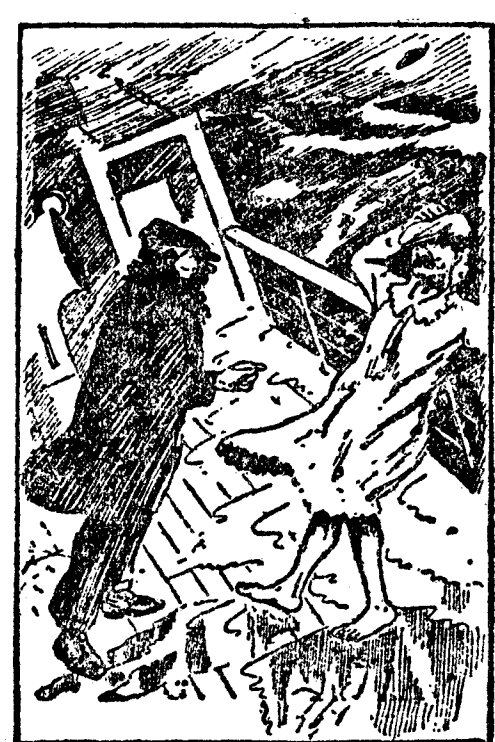
—Pero, ¿por qué sube usted a cubierta con esa ropa de mujer? —Porque se está esto poniendo tan serio que... ya sabe usted: primero, mujeres y niños. (Sidney Bulletin.)