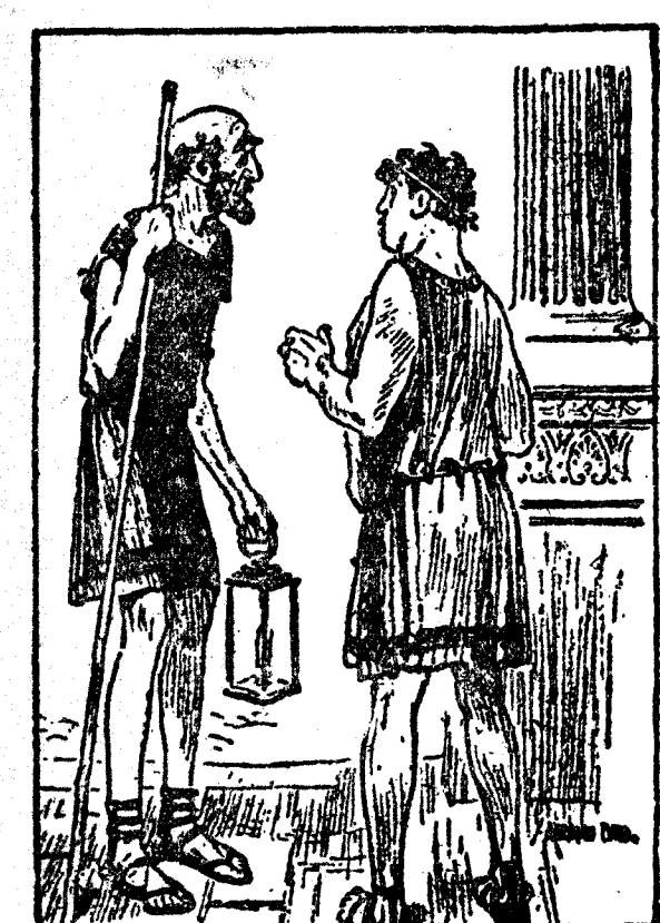
MIKE, EL GRIEGO.—Por favor, ¿qué hora es? DIOGENES.—Ignora usted que aun no se han inventado los relojes de bolsillo? (The Humorist, Londres.)

Peñalver. Arenal, 26, Madrid EXCLUSIVA PARA INGENIEROS INDUSTRIALES