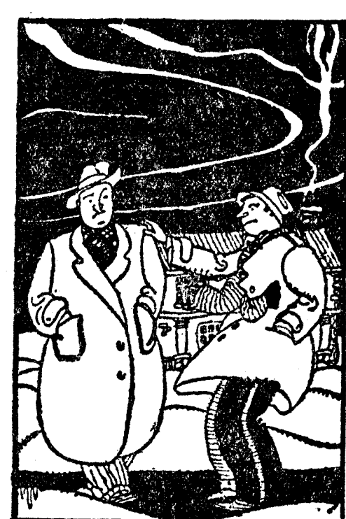
—¿Por qué no vuelves a casa? —Porque me ha echado mi mujer. —¿Y por qué te ha echado? —Porque no estaba nunca en casa. (Goblin, Toronto.)