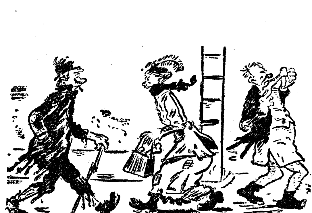
Cómo vestiríamos si cada uno ganase lo que oficialmente declara. (Sondagnisse-Striz, Estocolmo.)