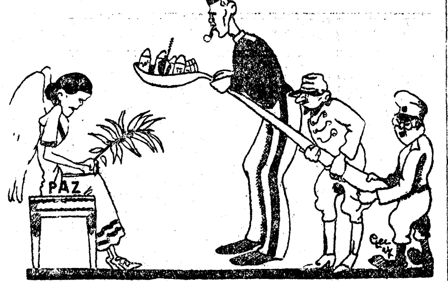
(Il. 420, Florencia.)