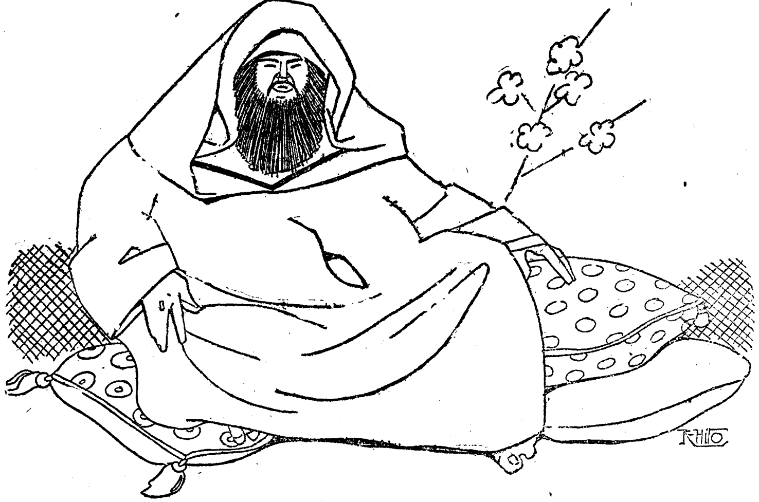
Ultimo retrato del nuevo alto comisario de España en Marruecos