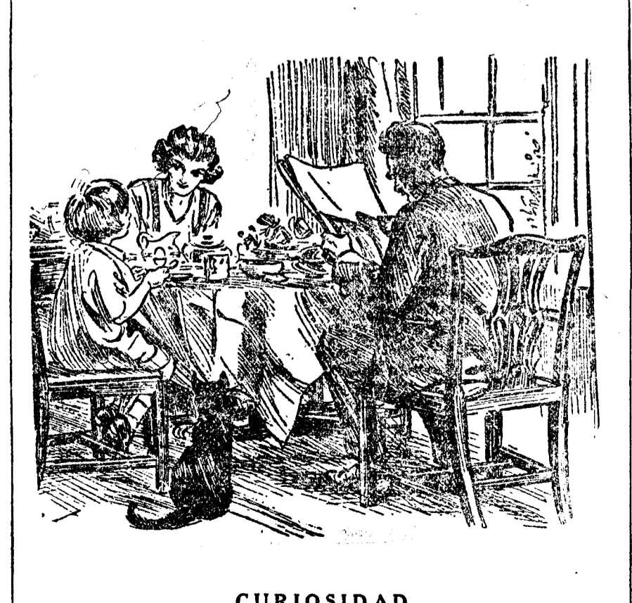
(Passing Show, Londres.)

CURIOSIDAD LA NIÑA.—Mamá, ¿cómo saben las gallinas el tamaño de mi huevera?