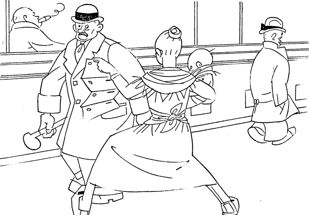
—¡Señorito, cómpreme "ustez" este capicúa y sonrías de los seguros!

Nombre siempre EL DEBATE al dirigirse a sus anunciantes