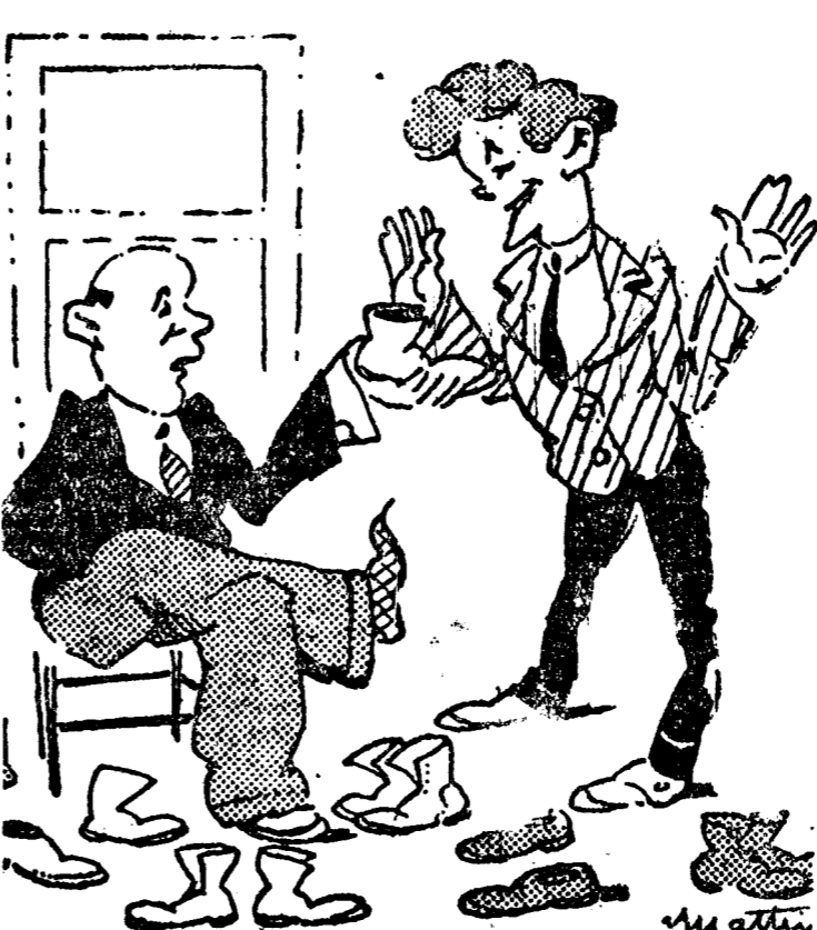
—¿Son buenas estas botas? —Duran eternamente. Todos los clientes nos vuelven a comprar a nosotros. (Père-Mélc, París.)