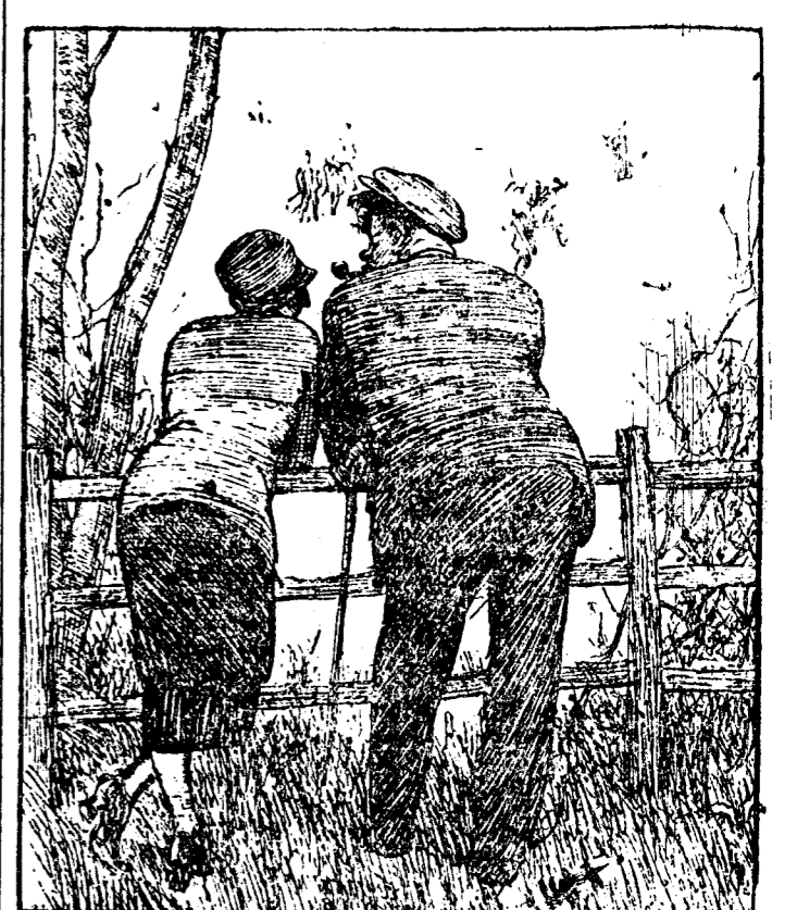
NUEVOS RICOS ELLA.—¿Qué opinas del “golf”? EL.—Que prefiero los tallarines a la napolitana. (Punch, Londres.)