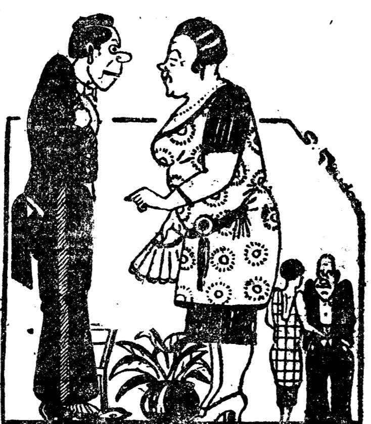
—Le aseguro, vizconde, que soy todavía de mediana edad. —Sí; yo siempre la he creído a usted de la Edad Media. (Père-Mélc, París.)