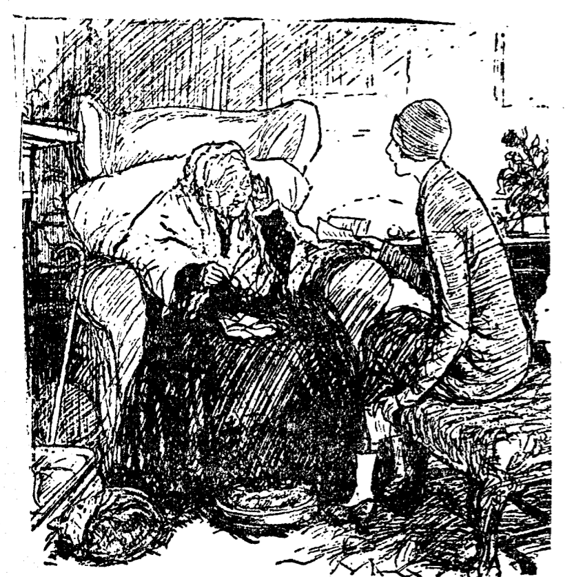
ANIVERSARIO LA DAMA ANCIANA (en su centésimo cumpleaños, confusa por edad, las felicitaciones).—¿Y cuántos cientos de años dicen que tengo, querida? (Judge, Nueva York.)

presenta las últimas novedades para temporada. MONTERA, 7. Teléfono 11.808.