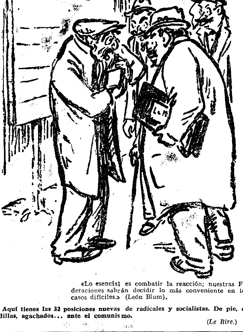
«Lo esencial es combatir la reacción; nuestras Federaciones sabrán decidir lo más conveniente en los casos difíciles.» (León Blum).

Aquí tienes las 32 posiciones nuevas de radicales y socialistas. De pie, de rodillas, agachados... ante el comunismo.