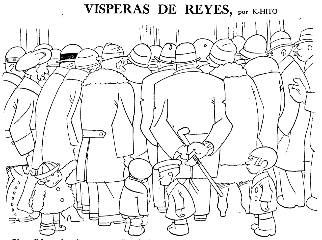
¡Cómo disfrutaban los niños en estos días viendo escaparates!