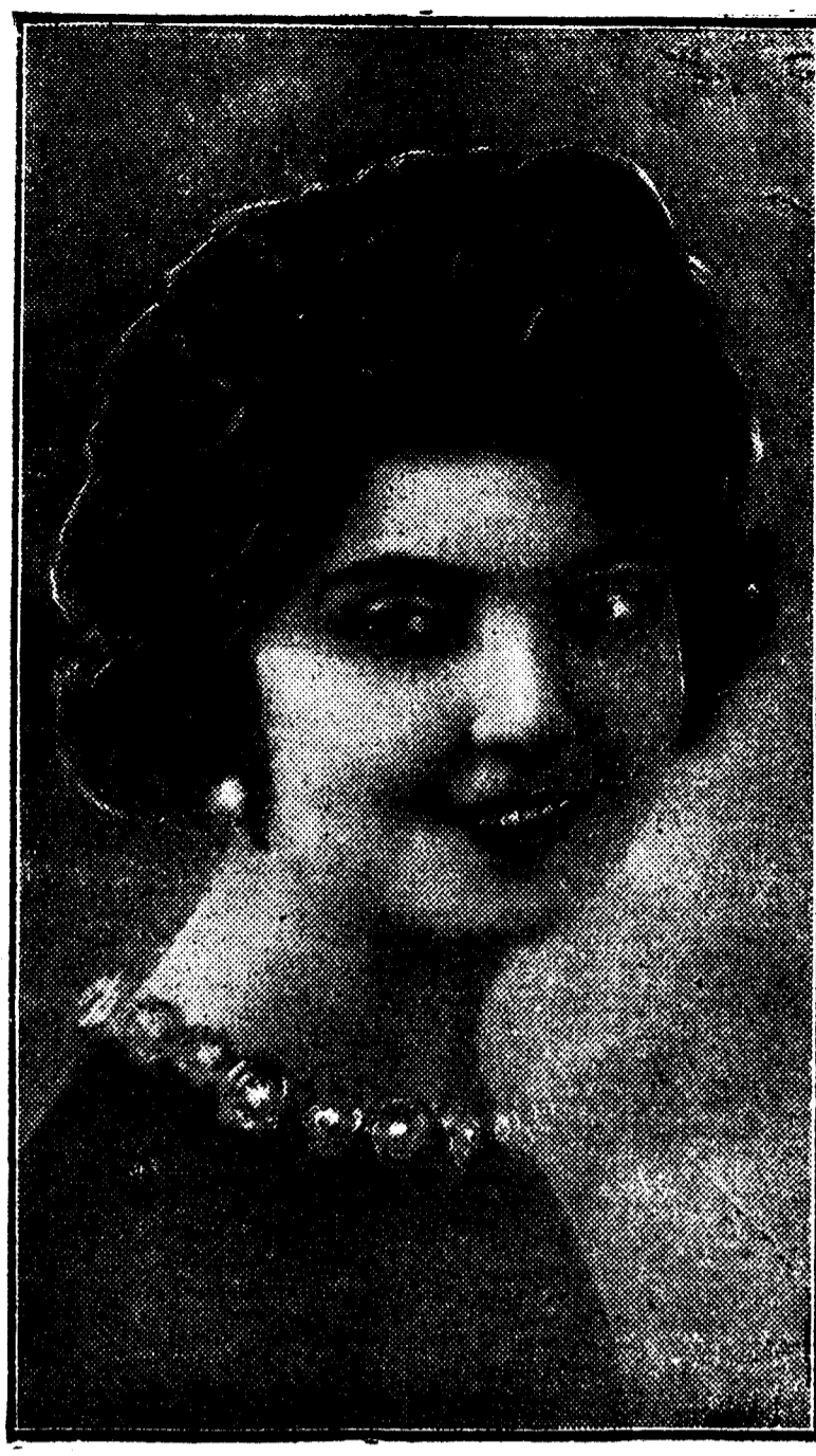
Conchita Supervia, cantante española, que anoche debutó en la temporada oficial de ópera

Conchita Supervia, la maravillosa cantante española, al presentarse de nuevo ante el público madrileño ha confirmado plenamente su prodigioso arte, de sensibilidad exquisita y de perfecta técnica.