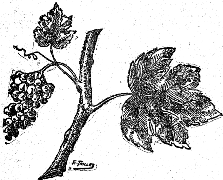
Vinedo sin «Sulfatizador», tratado con azufre solo.