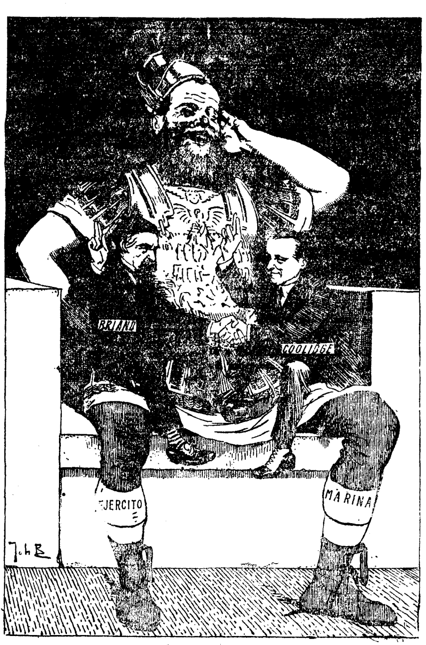
BRIAND Y COOLIDGE.—¿Quién se ha atrevido a reírse ahora? (De Groene Amsterdammer.)