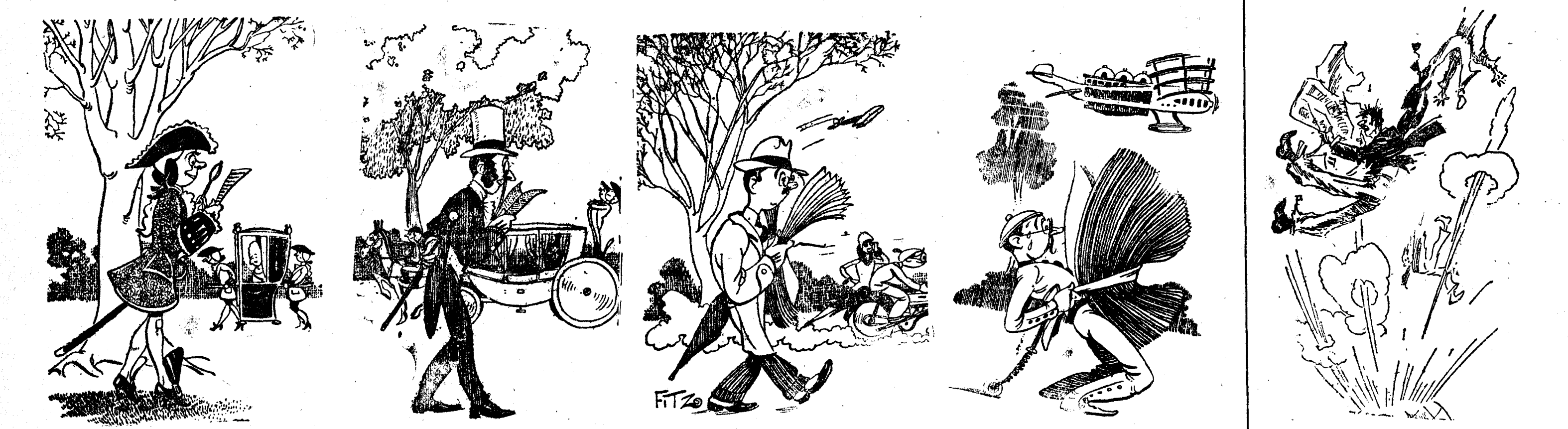
EL PROGRESO DEL PERIODISMO Año 1728 Una página Año 1828 Dos páginas Año 1928 Veinticuatro páginas Año 2028 Mli páginas (Passing Show, Londres.) (Refiriéndose a la rapidez de las informaciones.) —Vamos a ver lo que dice la Prensa de esta explosión. (London Opinion, Londres.)

El general Barrera ha aplazado hasta el sábado, su regreso a Barcelona.