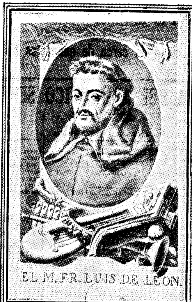
EL M. FR. LUIS DE LEÓN.

En este año de 1928 se cumplen los cuatro siglos del nacimiento de Fray Luis de León y los cien años de la muerte de Goya y del nacimiento de Cánovas. Una de las vueltas de la rueda del tiempo nos coloca a la vez ante el recuerdo de un gran poeta español, de un pintor insigne y de un político de eminente altura. Cada uno de ellos encarna un aspecto interesante de nuestra pasada vida.