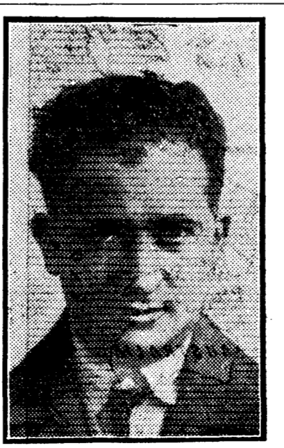
TENIENTE CORONEL FRANCO

La industria aeronáutica La industria aérea ha ido en continuo progreso, del que fué bello exponente la brillante fiesta aérea que, con asistencia de los Reyes y el Gobierno, y organizada por el jefe superior de la Aeronáutica Militar, coronel Kindelan, se celebró el 9 de junio en Getafe.