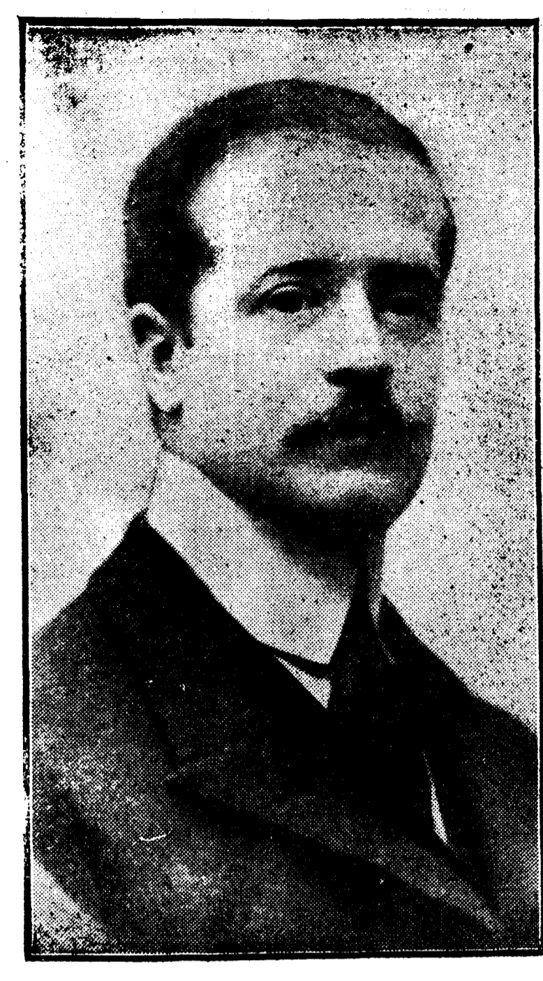
D. Mariano de Silva-Bazán y Carvajal, marqués de Santa Cruz, elegido decano de la Diputación y Consejo de la Grandeza de España