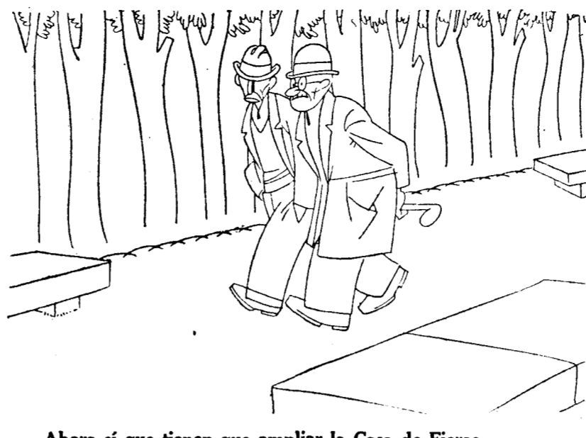
—Ahorra sí que tienen que ampliar la Casa de Fieras. —¿Por qué? —Pues... parece ser que, para estar con propiedad, cada camello exige delante de su estancia un "pequeño" desierto.