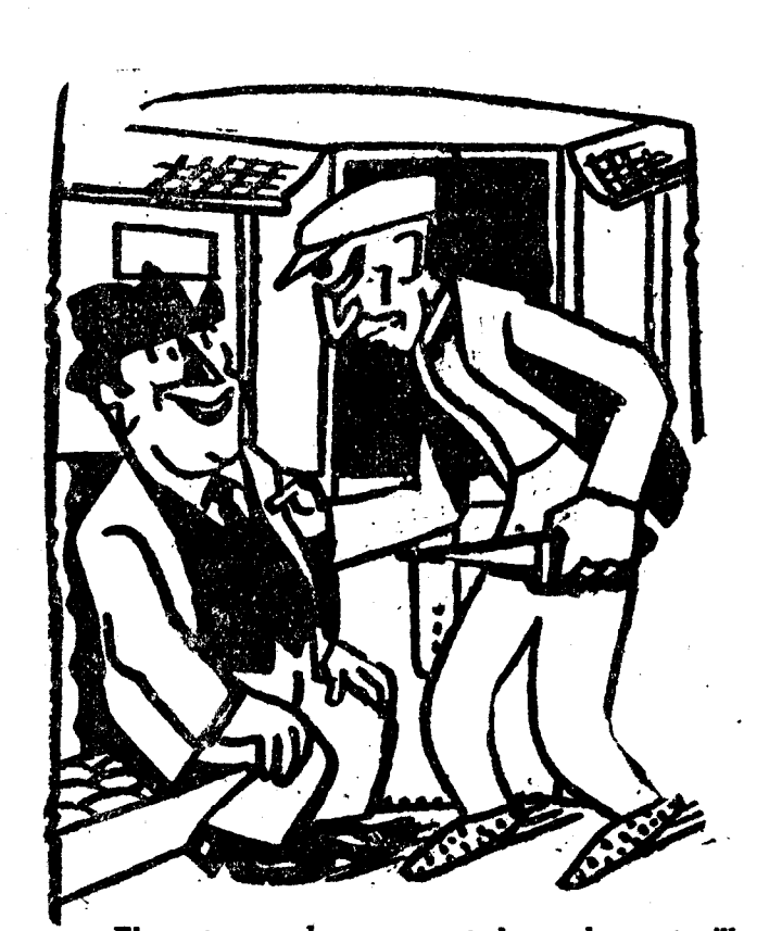
—El portamonedas o va usted por la ventanilla. ¡Ca, hombre! Está prohibido arrojar en marcha. (Pelle Mété, Paris.)