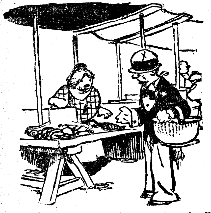
—Yo no le pregunto a usted si sus langostas están o no vivas. Yo le digo que si están frescas. (Eccleston, Paris.)

BERLIN, 10.—Diversas personalidades alemanas y americanas han cambiado hoy un saludo, con motivo de verificarse la apertura del servicio telefónico germanoamericano. Este servicio se efectúa, provisionalmente, por una estación intermedia, pero dentro de poco tiempo se realizará de un modo directo. Entre las personas que han cambiado saludos, al inaugurarse, figuran el señor Schuman, embajador de los Estados Unidos en la Gran Bretaña, y el señor Schatzki, ministro de Comunicaciones de Alemania. La audición fué clara y perfecta.