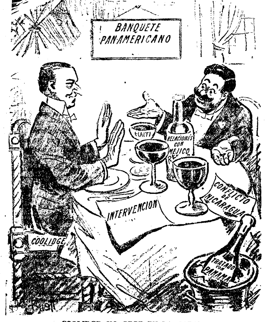
COOLIDGE NO BEBE EN LA HABANA (The Dallas News.)