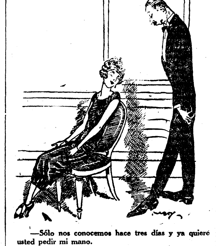
—Solo nos conocemos hace tres días y ya quiero usted pedir mi mano. No importa. Estoy empleado en la Banca de su padre. (Le Rire, Paris.)