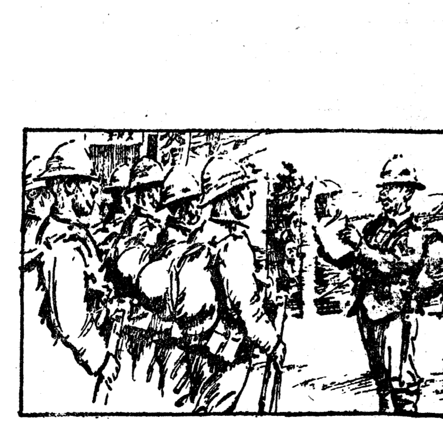
—«Como medida disciplinaria, a todo soldado que se encuentre negociando con el enemigo se le fusilará en el acto, para que, en lo sucesivo, se porte como manda la ley.» (Punch, Londres.)