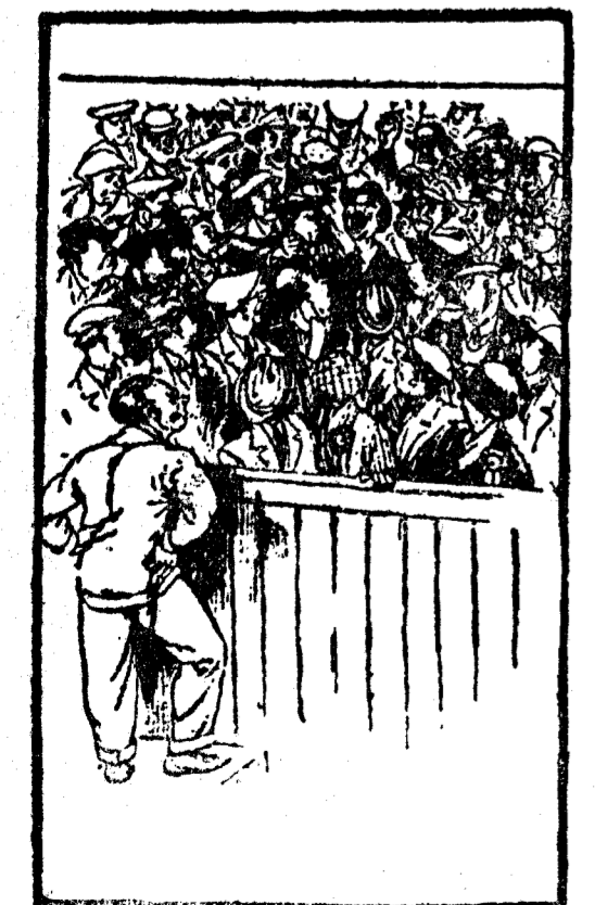
LAS TRAGEDIAS DE LA VIDA El orfeonista que sigue cantando cuando ya ha terminado la canción. (Passing Show, Londres.)

L. ASIN PALACIOS.—PRECIADOS, 23.—MADRID.