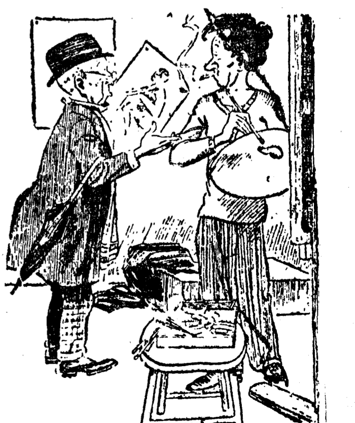
EL CASERO.—Todas las semanas me dice usted que vuelva la siguiente. Ahora comprendo en qué consiste el futurismo. (Sidney Bulletin, Sidney.)