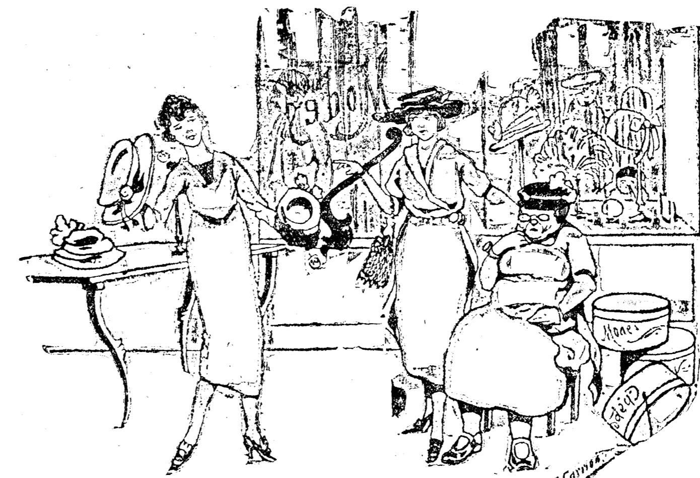
—Mamá, mira éso qué lindo. —Si, hija, pero son 75 pesetas. —Ven la señora que lleva un melocotón y dos guindas.