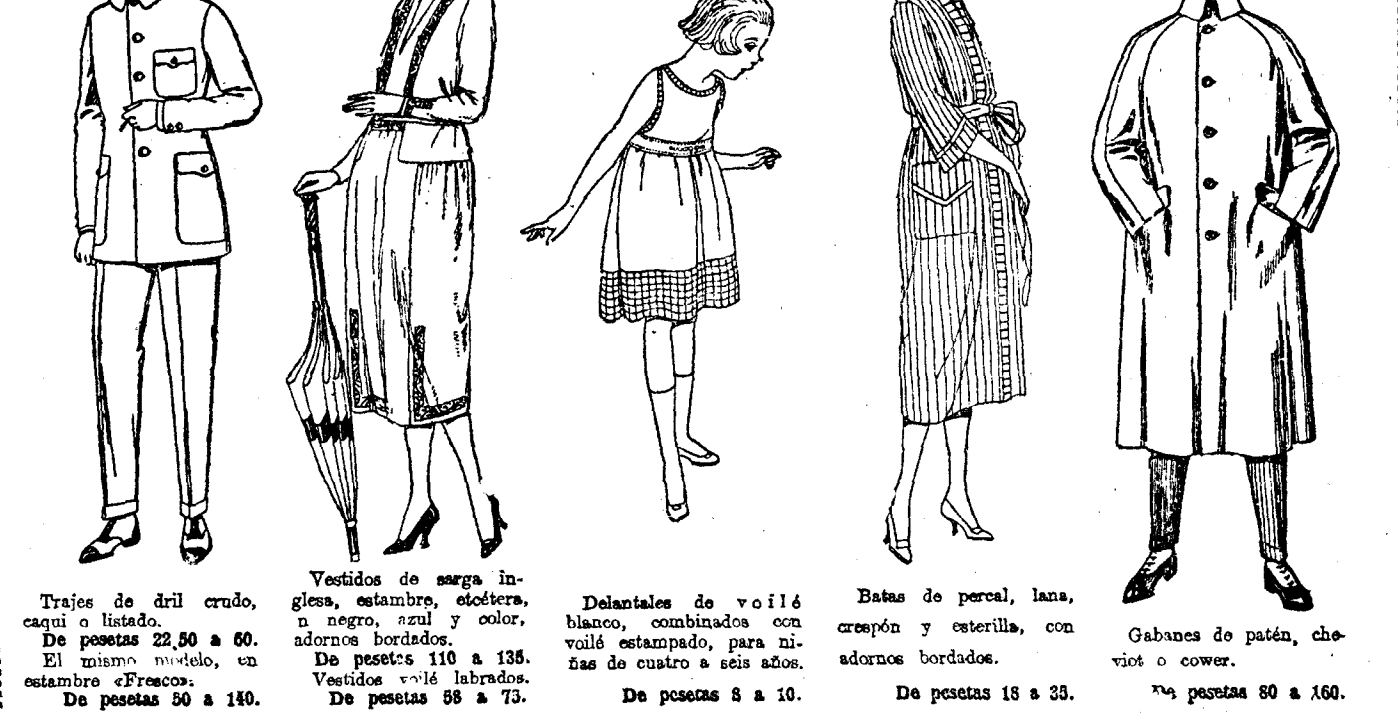
Trajes de dril crudo, caqui o listado. De pesetas 22,50 a 60. El mismo modelo, en estambre «Francos». De pesetas 50 a 140.

SUCURSALES: Barcelona, Alicante, Almería, Bilbao, Cádiz, Cartagena, Gijón, Granada, Málaga, Palma de Mallorca, Santander, Sevilla, Valencia, Valladolid y Zaragoza