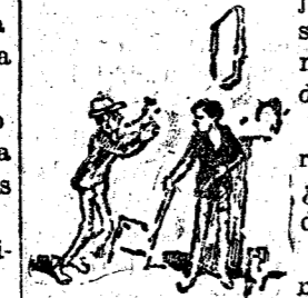
tendiéndole los brazos y gritándole: «¡Hiho!», con voz y ademán teatrales.

caro con la cara compungida, tendiéndole los brazos y gritándole: «¡Hiho!» con voz y ademán teatrales. —No hagas caso de embustes—le dijo la monja—. Tu padre era una persona fina, un caballero..., si no fuese un infame traidor. —¿Le conose usted?—interrogó ansioso el inclusero—. ¿Sabe usted quién es mi madre? —Yo... no. ¡No! Pero nosotras adivinamos estas cosas por mil signos y particularidades ocultas a la mirada de los demás—le contestó sor María. —Yo, ¿sabe usted?—decía Currito a la monja cada vez que hablaban de esto—, hubiera querido que me saliese mi padre pa conoser a mi madre y verla..., aunque na más fuera de lejos, aunque tuviera que besarla sólo con er pensamiento. Pero verla, ¿sabe usted? Verla y poder desí: «Esa mujé, esa señora tan guapa...» Porque mi madre tiene que ser señora, ¿verdad?... «Esa señora es tu madre.» ¡Ay, maresita mía, lo que te iba a querer tu hijo así fuera como fueras!... ¡Pero nunca sabré de ella!—concluía desconsolado—. No tendré más madre que usted.