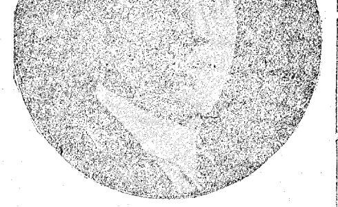
GEORGES CARPENTIER, derrotado en el campeonato francés

El peso marca 172 libras para Carpentier y 168 para Dempsey.