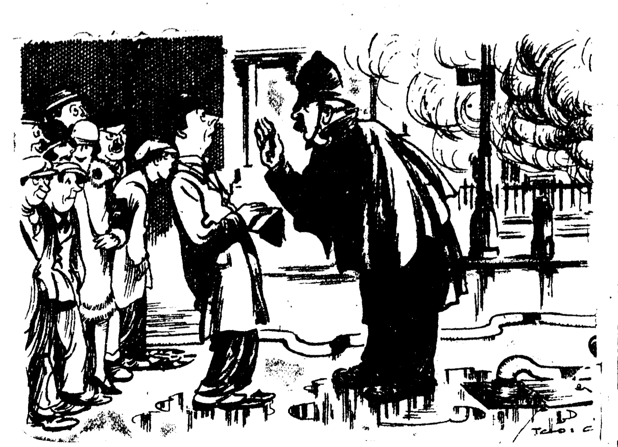
EL PERIODISTA.—Es que soy reporter y necesito conocer los detalles del siniestro. EL GUARDIA.—Pues lea usted mañana por la mañana los periódicos y se enterará de todo. (The Passing Show, Londres.)