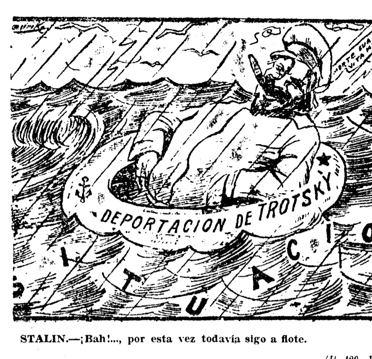
STALIN.—¡Bah!..., por esta vez todavía sigo a flote.