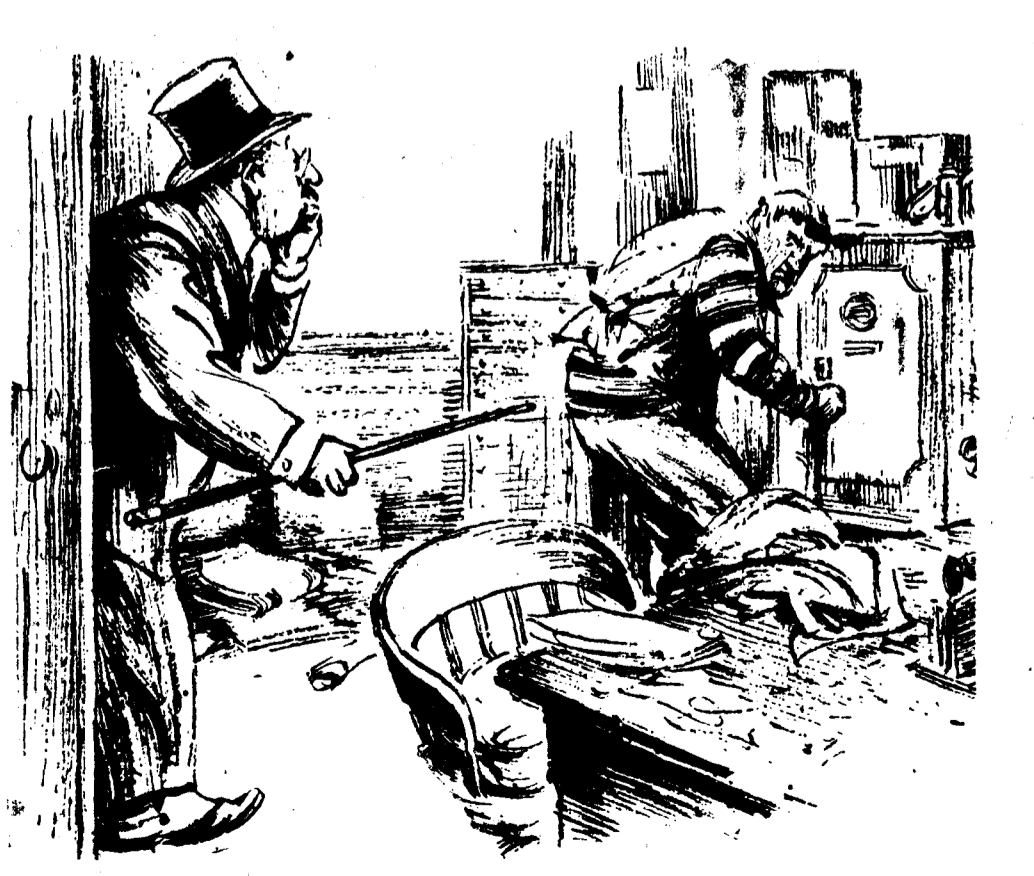
EL USURERO.—¿Qué desea usted? EL LADRON.—¿Dinero? EL USURERO.—¿Qué garantía puede usted ofrecer? (London Opinion, Londres.)