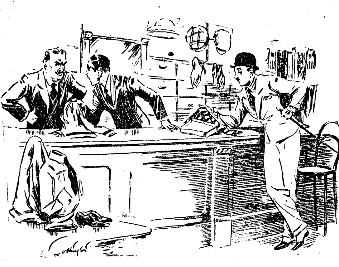
EL DEPENDIENTE (al dueño).—Ese caballero pregunta que si encogerá esta camiseta. EL DUENO.—¿Le está grande? EL DEPENDIENTE.—Sí, señor. EL DUENO.—Entonces... ¡claro que encogerá! (The Humourist, Londres.)

España fué la primera nación latina que se adhirió a la «Sociedad Internacional de Estudios para la exploración de las regiones árticas an dirigible», que preside el famoso explorador y filántropo Fridtjof Nansen, y de la que forma parte el doctor Torroja. Entre los fines de esa Sociedad está el de crear varios observatorios filios sobre las comarcas polares y en comunicación permanente con los europeos.