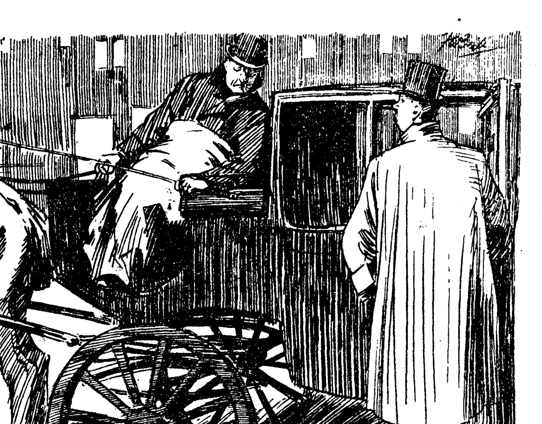
—Oiga, cochero, lléveme hasta una parada de "taxi". (The Passing Show, Londres.)