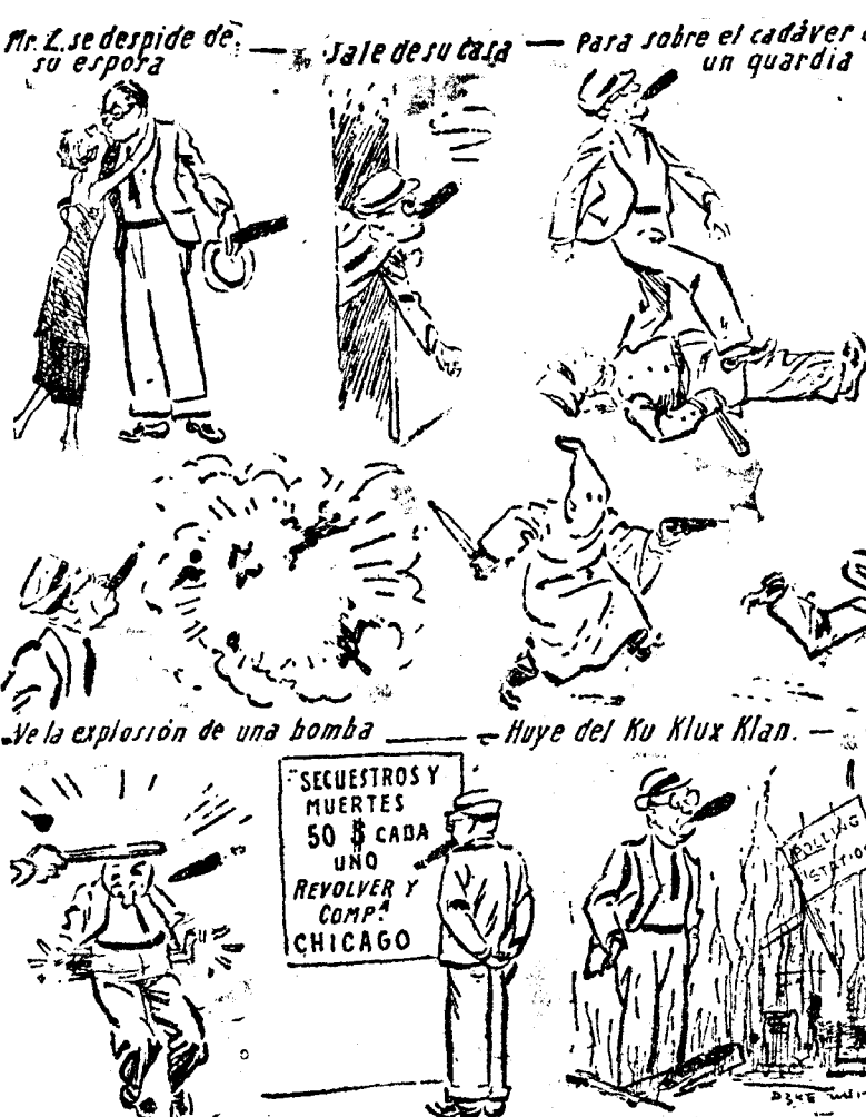
LA JORNADA DE UN CIUDADANO PACIFICO (Glasgow Daily Record.)