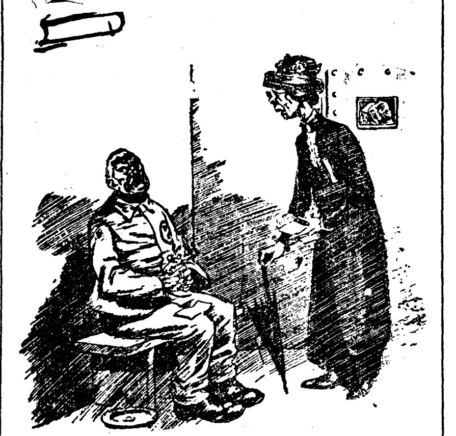
LA SEÑORA.—¿Puedo hacer algo por usted, desgraciado? EL RECLUSO.—¡Claro que sí!... ¡Puede usted cumplir mis doce años! (Bulletin, Sydney.)