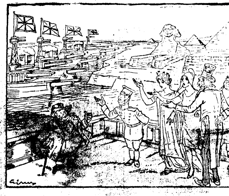
—¿Señor John Bull, ¿está la teoría del desarme? —No, señores, está la práctica. (Guerra Meschino, Turin.)