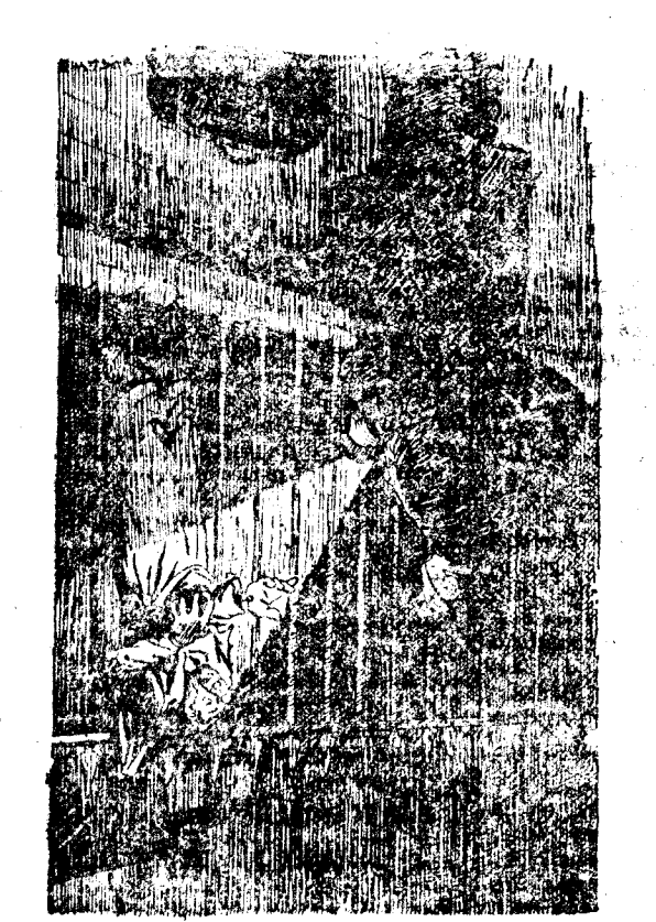
EL GUARDIA.—¿Hola! ¿Qué haces ahí? EL LADRON (que al escalar una casa se ha quedado enganchado en la verja).—Pues... ya lo ve usted... ¡tomando el fresco!