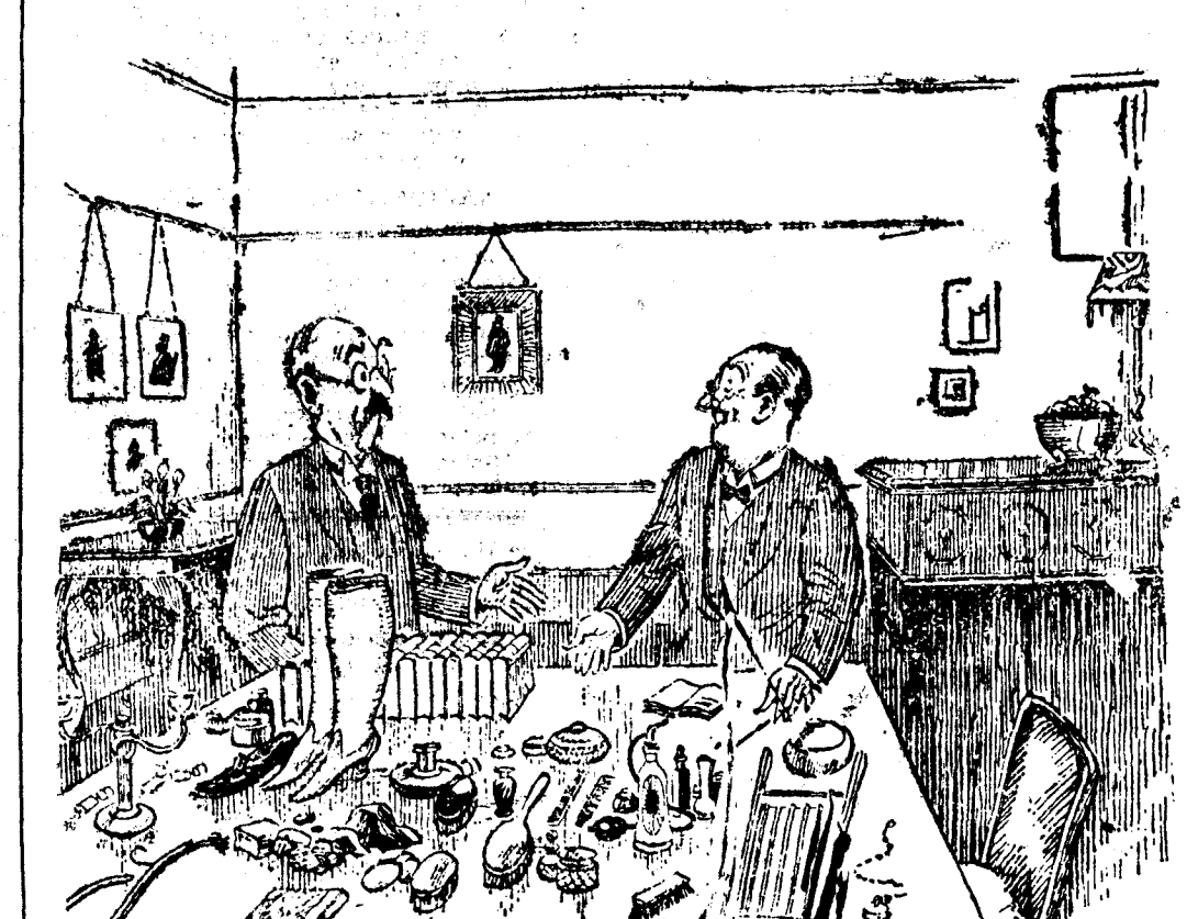
EL AMIGO.—Pues ¿y esa colección de objetos? EL DUEÑO DE LA CASA.—Es lo que los vecinos le han tirado a mi gato durante el último trimestre.