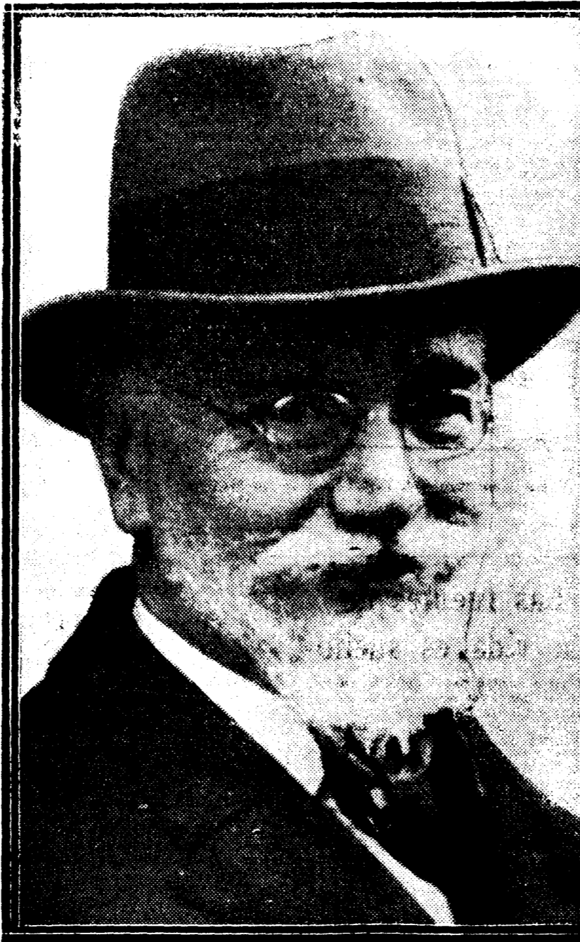
Venizelos, ex presidente del Consejo de ministros de Grecia, retirado hace años de la política, que se dice que vuelve al Poder.

Venizelos ha sido en Grecia todo lo que un hombre puede ser en su país. Insurreto en 1897, administrador de Creta hasta 1903, presidente del Consejo de ministros para salvar a la Monarquía en esa misma fecha, presidente para derrocarla unos años más tarde, dueño absoluto del país durante la gran guerra y condenado al ostracismo dos años después del armisticio. Allí ha permanecido esperando, según decía, a que el pueblo le llamara. No le ha llamado y vuelve, a pesar de todo. Y como no es fácil presentarse ahora como salvador de Grecia, declara que viene a evitar la ruina del partido liberal. ¡La nostalgia del Poder, la ambición que ciega las mentes más esclarecidas!