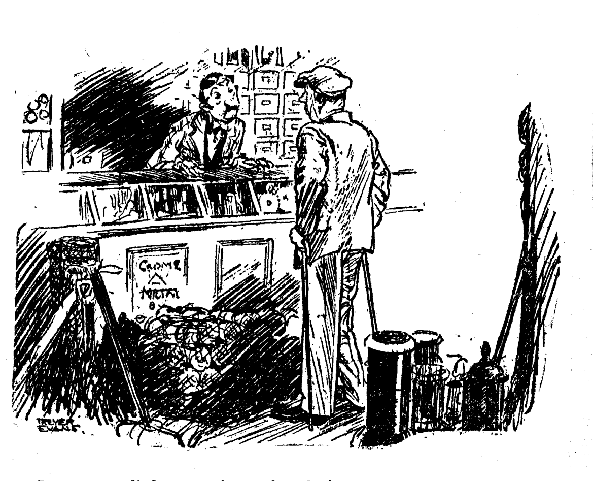
—Desgo unas tachuelas para sujetarme los calcetines. —¿Unas tachuelas? —Sí; es que tengo una pierna de madera.