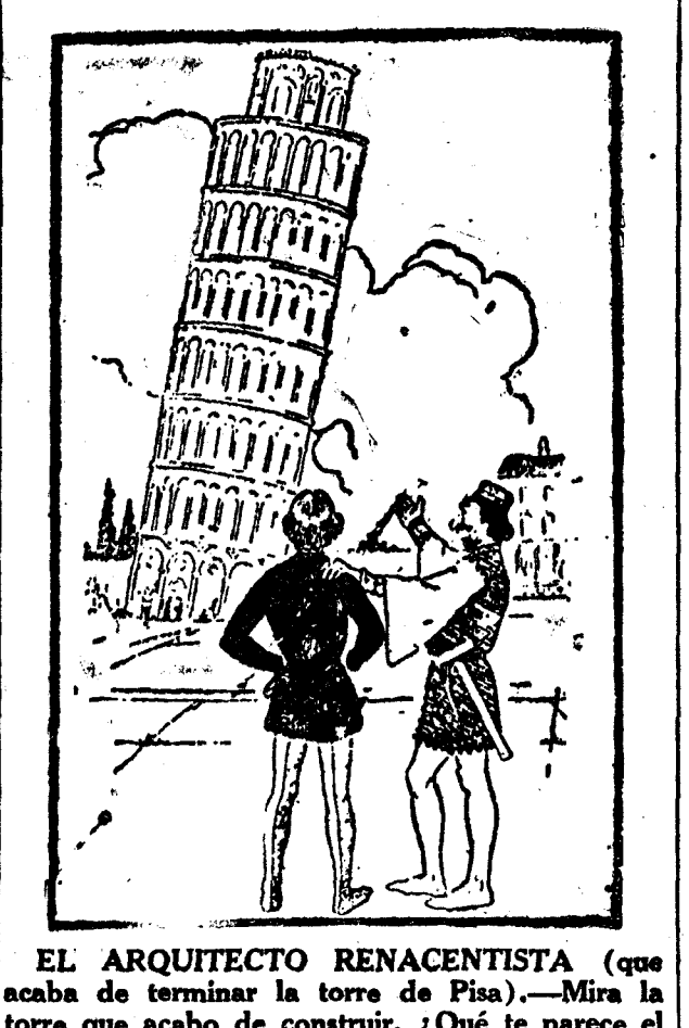
EL ARQUITECTO RENACENTISTA (que acaba de terminar la torre de Pisa).—Mira la torre que acabo de construir. ¿Qué te parece el trabajo? EL AMIGO (que no se deja asombrar).—No está mal. Pero deberías haberla hecho de modo que pudiera inclinarse para los dos lados.