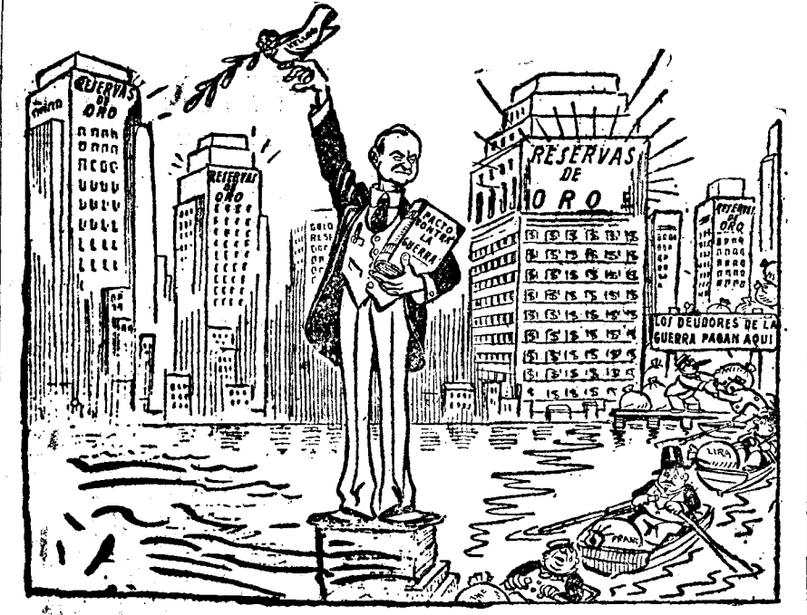
COOLIDGE.—Gentlemen: la guerra es una cosa terrible. (The Daily Express, Londres.)