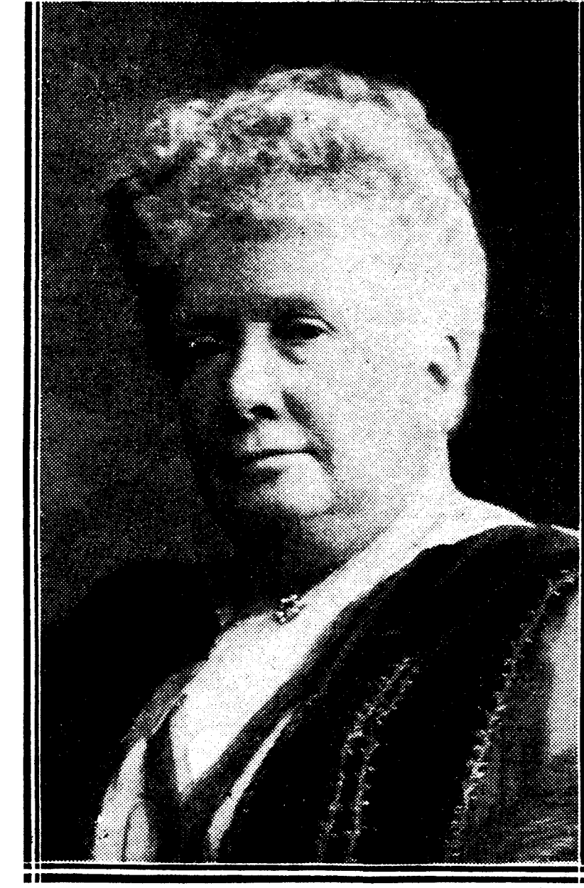
Su alteza real la serenísima señora doña Isabel de Borbón, Infanta de España.

Ennoblecimiento hoy esta sección de EL DEBATE una figura augusta: la de la Infanta Isabel, a quien se le confirió un alto galardón: el que en España se ideara para proclamar y reconocer la piadosa y constante vigilancia del espíritu en beneficio de la paz y la felicidad ajenas.