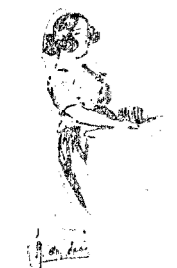
...de una buena moza...