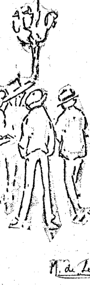
...en los corrillos entorpecedores de la calle de Sevilla...

buscaba preferentemente la bromista tertulia del «brasero», donde los temas taurinos eran tratados entre donosas burlas, más divertidas que una función de teatro.