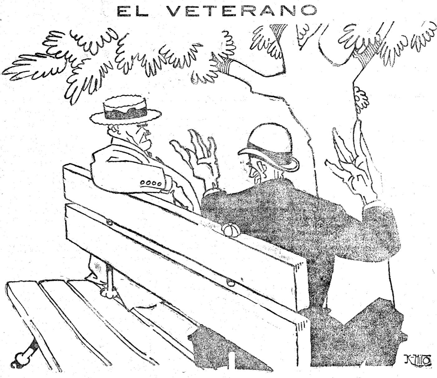
—Dos veces he estado en Africa y me tenían que sujetar para que no saliera al campo. —¿En Melilla? —No, en el penal de Ceuta.

CHAFARINAS Artillería a Cabo de Agua CHAFARINAS, 20.—El vapor «Juan de Juanes» ha traído esta plaza abundante material de Artillería destinado a Cabo de Agua; también una sección de Artillería, que ha de reforzar aquella posición.