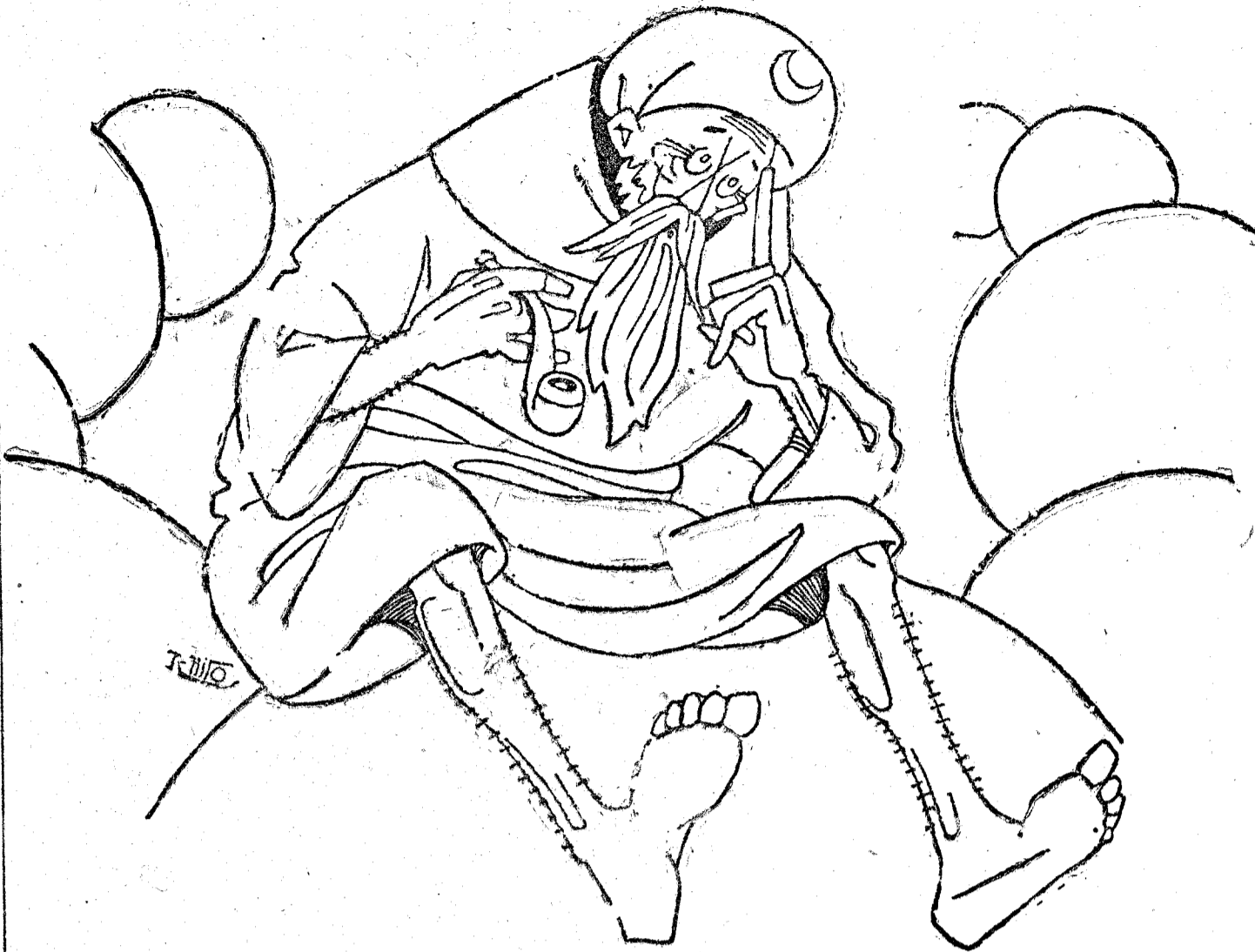
—Si a los moros buenos los llevo al Paraíso y a los moros malos los mando al diablo. Pero, ¿qué hago yo con los Regulares?