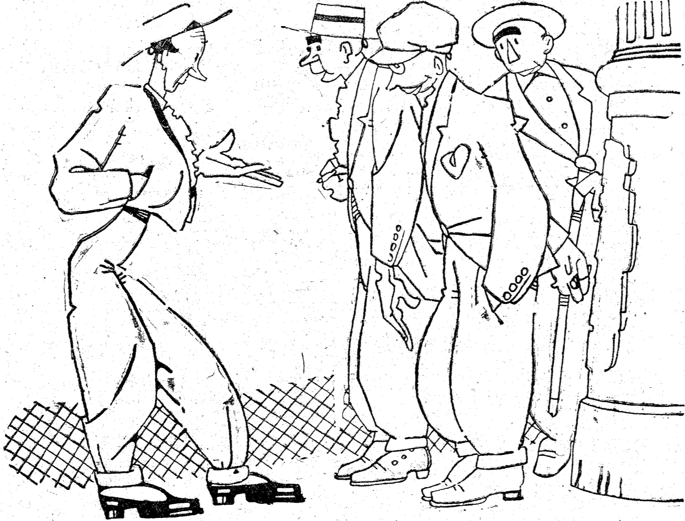
—Y qué hizo el presidente? —Pues me dijo que estuve «mu güeno»; pero que al precio que está la carne no se atrevía a dar...