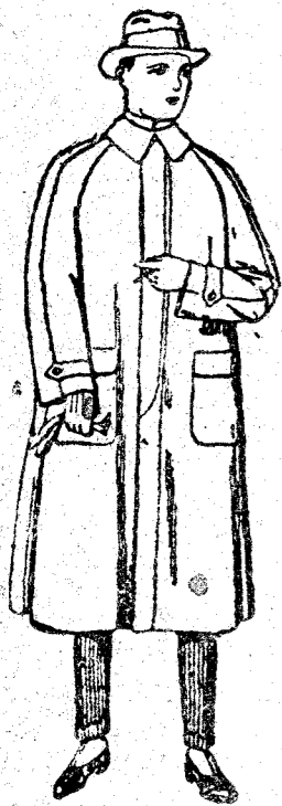
Impermeables ranglén, en azul y colores. De pesetas 40 a 170.

Madrid, Barcelona, Alicante, Almería, Bilbao, Cádiz, Cartagena, Gijón, Granada, Málaga, Palma de Mallorca, Santander, Sevilla, Valencia, Valladolid, Zaragoza.