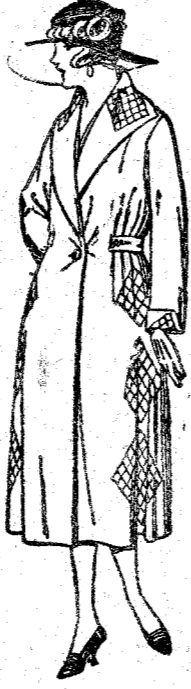
Abrigos de gamuza, ratina, etcétera, en negro, azul y color, adornos pespunteo seda. De pesetas 65 a 110.