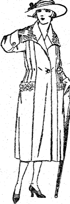
Abrigos de paño, gamuza, etcétera, en azul y color, adornos bordados. De pesetas 70 a 120.

Ropas confeccionadas para Caballero, Señora, Niño y Niña GENEROS NACIONALES Y EXTRANJEROS PARA PRENDAS A LA MEDIDA