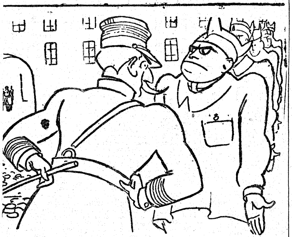
—¿Sabe usted leer y escribir? —Escribir solamente, mi coronel.

LA MADRE.—¿Qué harás tú, hijo mío? BILLY.—Te acompañaré yo mismo en un "taxi". ("London Opinion", Londres.)