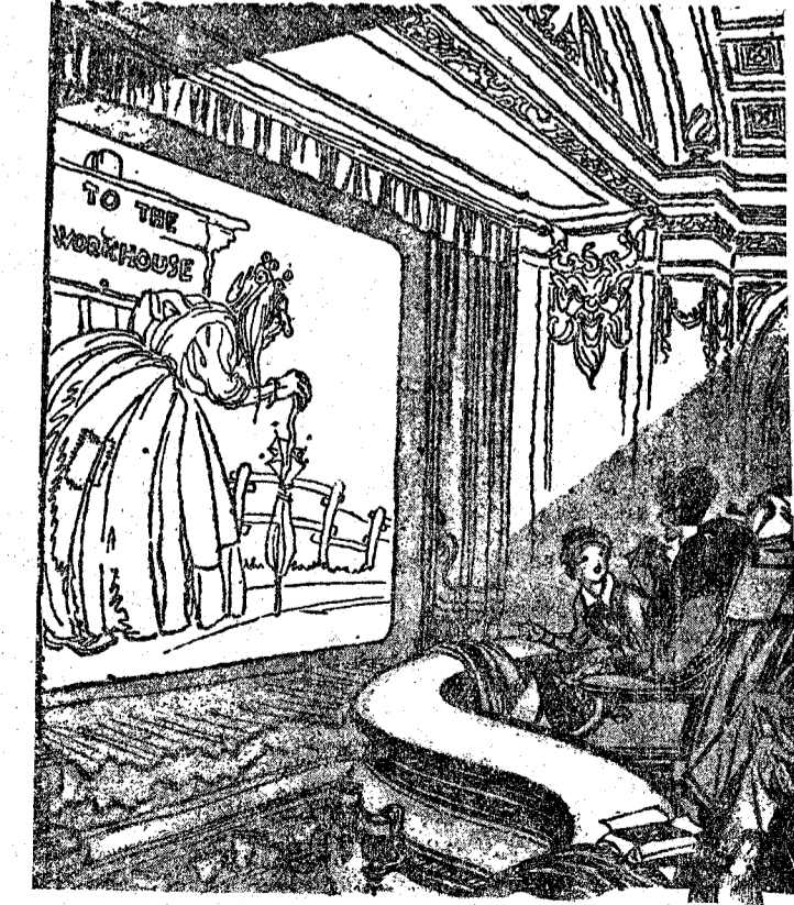
BILLY (al ver llorar a su madre).—No llores, mamá. Cuando tú seas vieja yo no consentiré que vayas al asilo de ese modo.

Te hará invulnerable a la gripe, pulmonía y catarros antiséptizando tus vías respiratorias con PASTILLAS CRESPO.