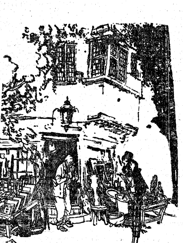
LA SEÑORA.—Aquel cuadro de Rubens que tiene marcado el precio de trece pesetas, ¿es auténtico o es una copia?