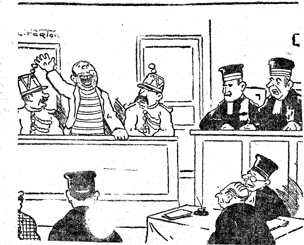
EL JUEZ.—La primera persona que perturbe la audiencia con aplausos o gritos será expulsada. EL REO.—¡Bravo! ¡Hip! ¡Hip! ¡Hurraa!