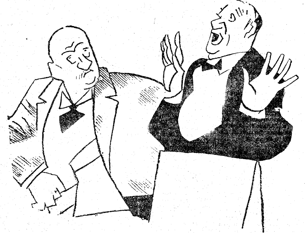
EL MOZO.—De ninguna manera, señor; si tiene usted voluntad de regalarme alguna cosa, puede obsequiarme a fin de año con una casita u otra cosilla por el estilo; pero propinas, no.