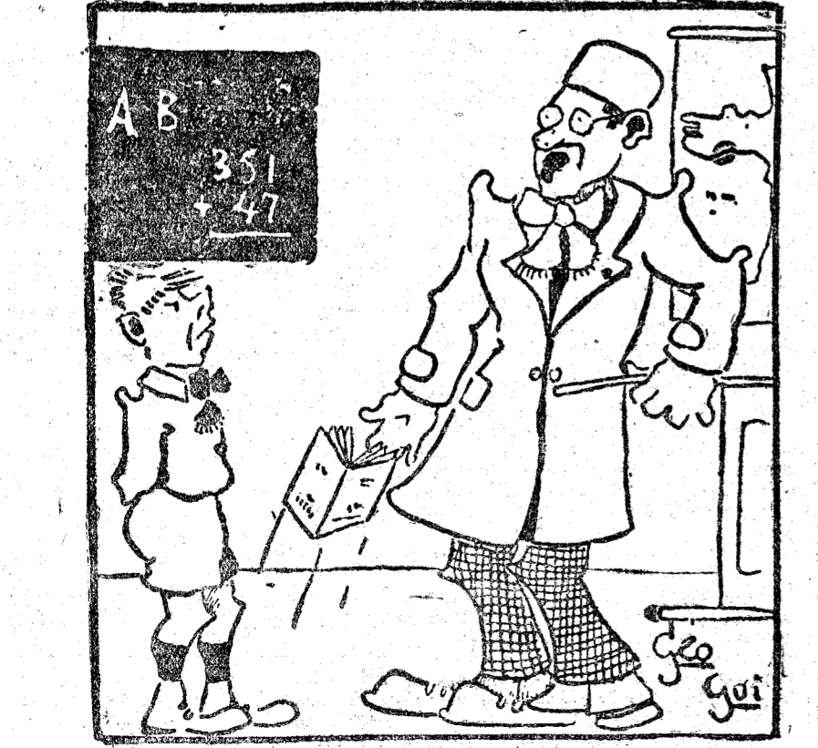
—¿De modo que no sabes qué significa adversario? Si yo lucho contigo... ¿qué soy? —El más fuerte. ("Dimanche Illustré", Paris.)