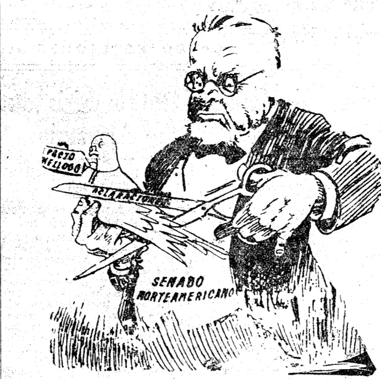
ES UNA PALOMA MUY BONITA, PERO...