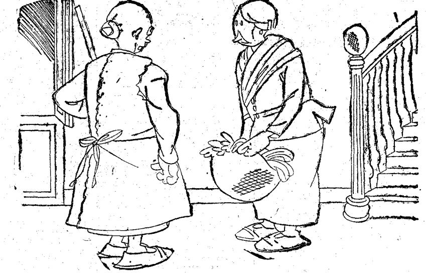
—Lo que le digo; tres días lleva mi marido sin aparecer por casa. —¿Y no lee "ustez" los papeles? ¡A lo mejor se ha proclamado Rey del Afghanistan!