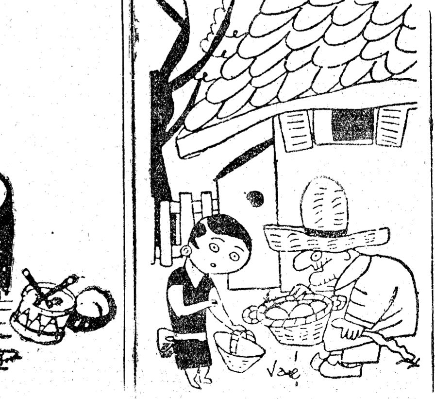
—¿Me garantiza usted que son huevos del día? —Sí, señora, sí. Mis gallinas no ponen de noche.