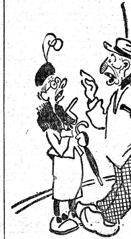
—¡Oh! No beba usted. Con lo fuerte que es, sin el alcohol podría llegar a los ochenta años. —No me conviene: tengo ochenta y uno. ("Excelsior", Paris.)