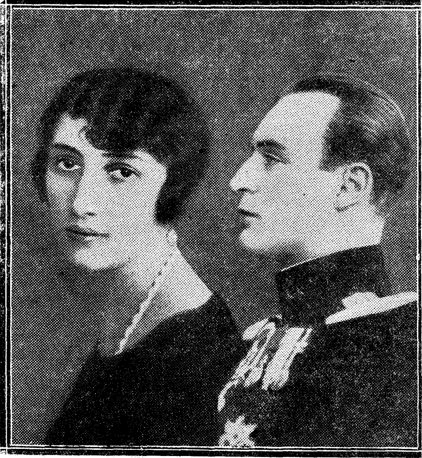
El príncipe Olaf de Noruega y la princesa Marta de Suecia, que en breve contraerán matrimonio

La princesa Marta es sobrina del rey Gustavo V de Suecia e hija del príncipe Oscar Carlos, duque de Vestrogotia, y de la princesa danesa Ingeborg. Cuenta veintisiete años en la actualidad. El príncipe Olaf es el hijo único del rey Haakon VII de Noruega y de la reina Maud. Nació en Appleton Hall, en el condado de Norfolk, en 1903, cuando su padre era todavía Príncipe heredero. Tiene un año menos que su prometida. Ha hecho sus estudios en la Academia Militar de Oslo primero y en la Universidad de Oxford después. Como su hermana, la princesa Marta se casa con un Príncipe heredero; es decir, que las dos serán con el tiempo Reinas. Ella, de Noruega, y su hermana Astrid, de Bélgica. La boda se celebrará el próximo 21, no obstante estar convenida hace ya dos años y medio; pero se guardó reserva hasta esperar que el príncipe Olaf acabara sus estudios.