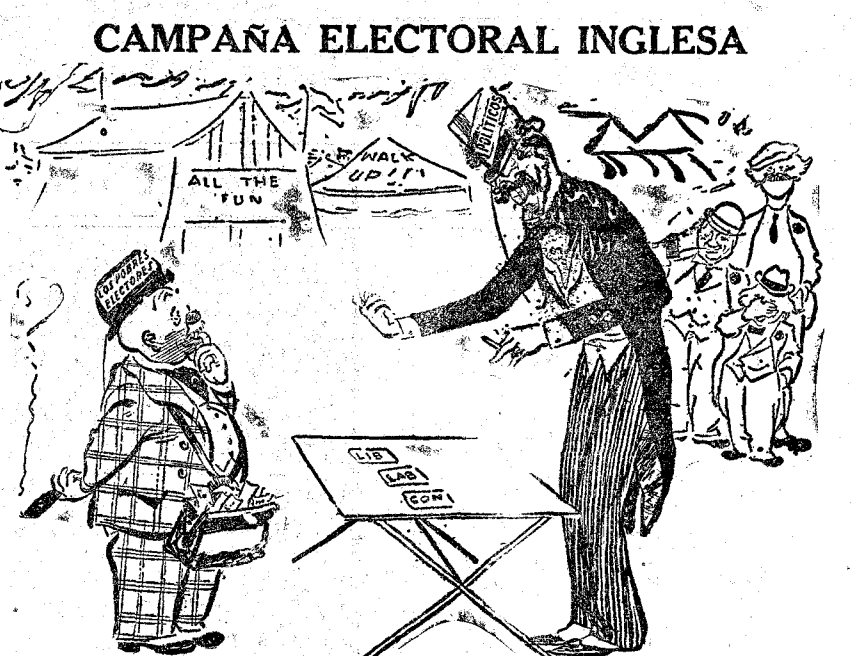
EL PORRECITO DE SIEMPRE

Mistol CURA LOS RESFRIADOS EN 24 HORAS Por mayor: BUSQUETS Hermanos y Compañía RONDA ATOCHA, 23. — MADRID