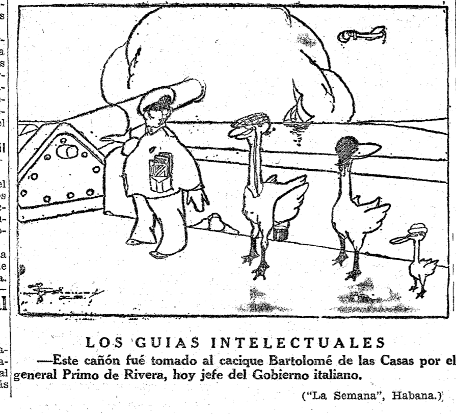
LOS GUIAS INTELECTUALES —Este cañón fué tomado al cacique Bartolomé de las Casas por el general Primo de Rivera, hoy jefe del Gobierno italiano.