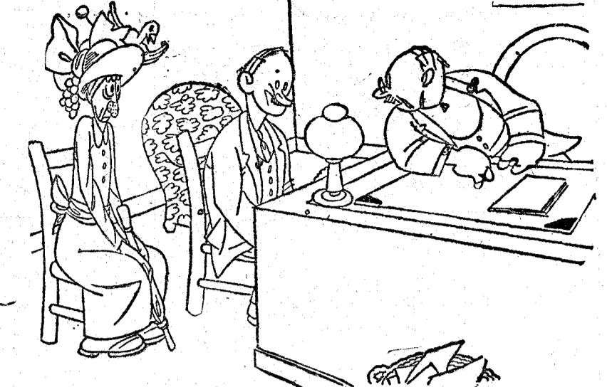
—Está bien todo eso, señor; pero para divorciarse de su esposa tiene que expresar las causas en que se funda la demanda. —Pues... que me gusta más el modelo 1929.