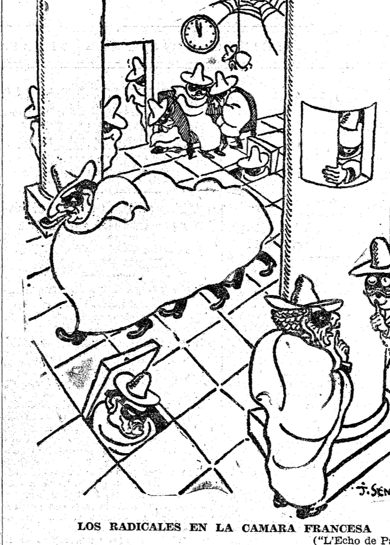
LOS RADICALES EN LA CAMARA FRANCESA ("L'Echo de Paris")